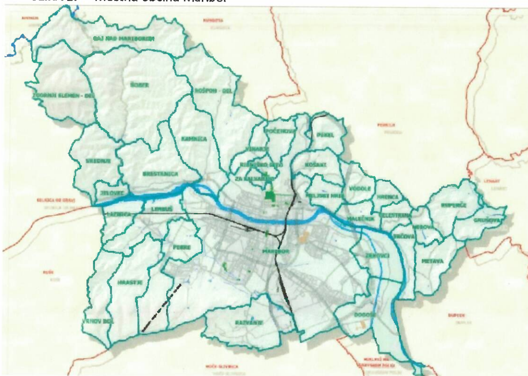
SLIKA 1: Mestna občina Maribor