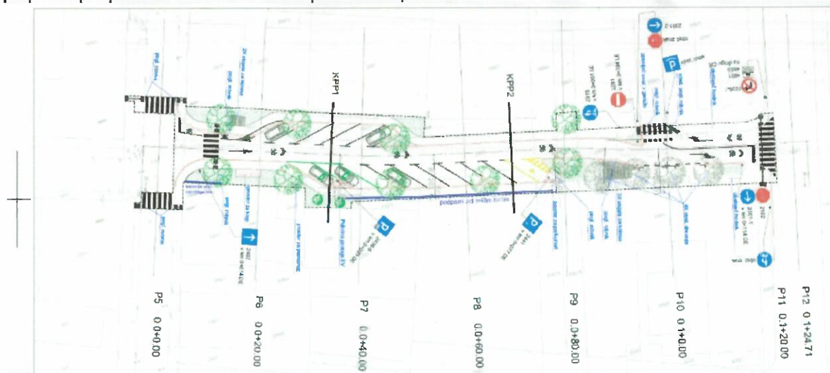
Slika 1: Gradbena situacija

posega je predvidena dvosmerna ureditev prometa le od ulice Ob bregu do uvoza v garažo večstanovanjskega objekta Ob bregu 24. Na razpoložljivem prostoru ureditve se predvidijo parkirna mesta s poševnim parkiranjem pod kotom 30°. Predvideno je 17 parkirnih mest, od tega dva za vozila na elektro pogon in eno parkirno mesto za invalide. Pred objektom Ob bregu 22 se predvidoma ohranita dve parkirni mesti za vzdolžno parkiranje. Pred objektom se ohranijo tudi drevesa. Ta so predvidena za zasaditev tudi na preostanku ureditve ulice. Na obeh straneh so predvidene površine za pešce. Kolesarji se v smeri zahod – vzhod vodijo skupaj z motornim prometom po voznem pasu, v nasprotni smeri pa po skupni površini na severni strani prometnih površin.