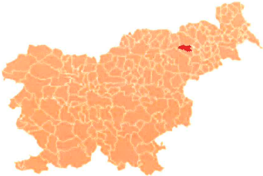
Slika 2: Lega Občine Hoče-Slivnica v Republiki Sloveniji