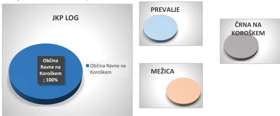
SLIKA 2: OBČINA RAVNE NA KOROŠKEM PREVZAME JKP LOG (PREVZAME DELEŽE OSTALIH OBČIN) IZSTOP OBČIN PREVALJE, MEŽICA IN ČRNA NA KOROŠKEM

Iz omenjenih razlogov ocenjujemo , da za potrebe Občine Ravne na Koroškem scenarij 3 ni primeren in z njim ne bi mogli uresničiti vseh ciljev kot so finančni, organizacijski, kadrovski, ipd. za samostojno izvajanje dejavnosti Občine Ravne na Koroškem, kot smo si jih s spremembo organiziranosti zastavili. Iz teh razlogov scenarij zavračamo.