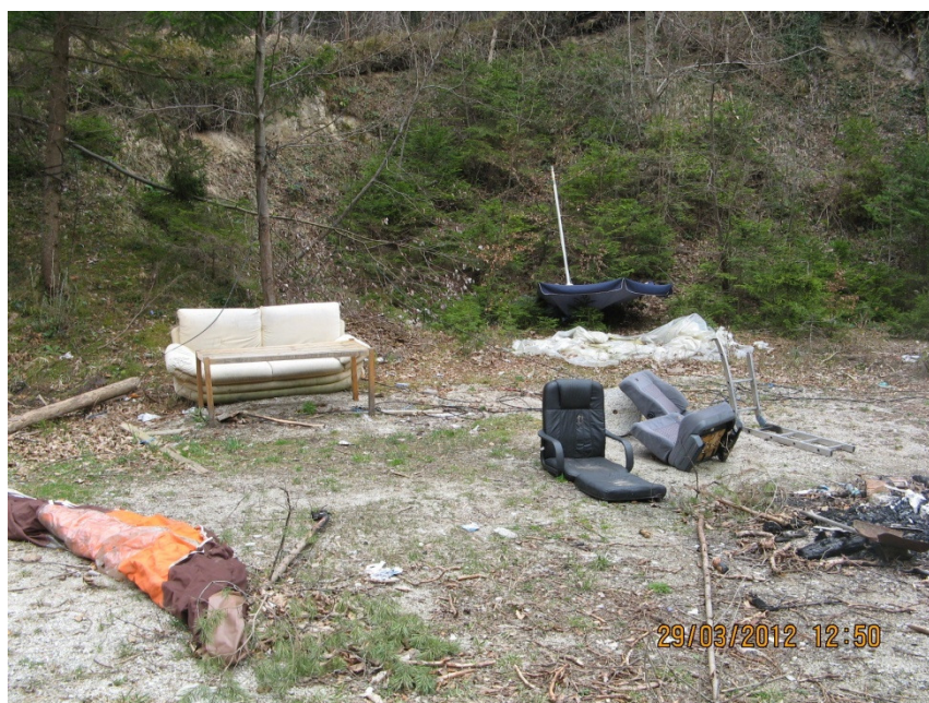
Slika 5: Nepravilno ravnanje z odpadki.

Glede na dejstvo, da občino obišče veliko turistov, smo se z opozarjanjem lastnikov neurejen okolice in objektov trudili, da ne izgubi slovesa lepo urejen občine.