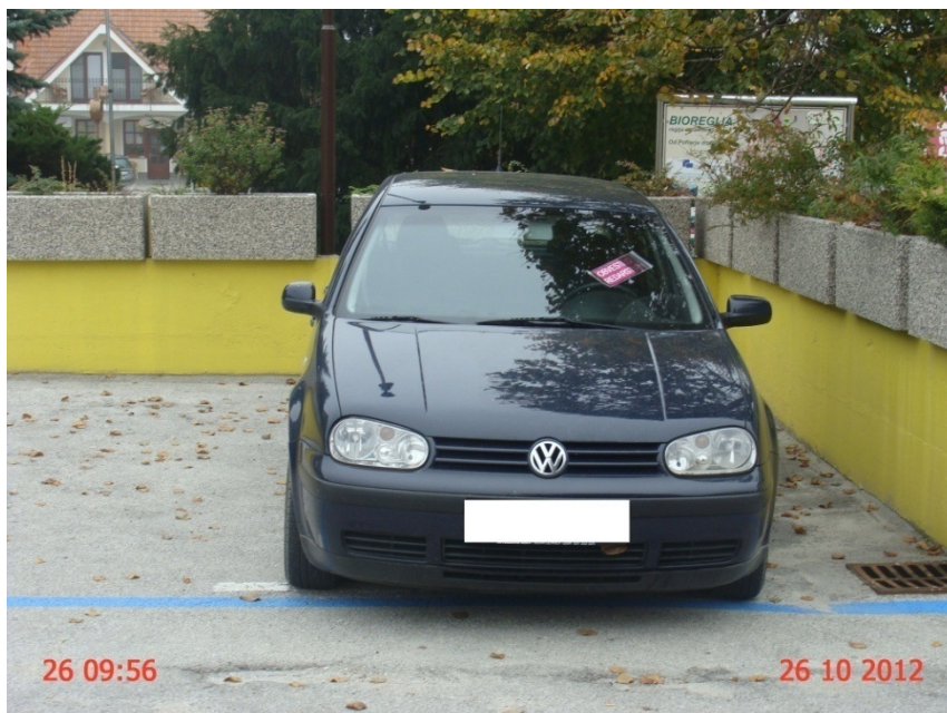
Slika 1: Vozilo brez označene ure prihoda.

Nadzor nad spoštovanjem nove prometne ureditve je obseg dela redarske službe v Občini Zreče povečal. Zaradi večjega števila storjenih prekrškov in posledično vloženi ugovorov in zahtev za sodno varstvo, se je povečalo tudi delo inšpektorice kot prekrškovnega organa.