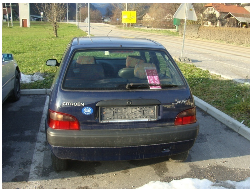
Slika 2: Zapuščeno vozilo.

Na področju zapuščenih in izrabljenih vozil velja omeniti, da se je število le teh v letu 2012 glede na predhodna leta zmanjšalo, kar pomeni, da postajajo ljudje bolj ozaveščeni. Obravnavali smo le dve zapuščeni vozili, ki pa sta jih lastnika v odrejenem roku pravilno odstranila.