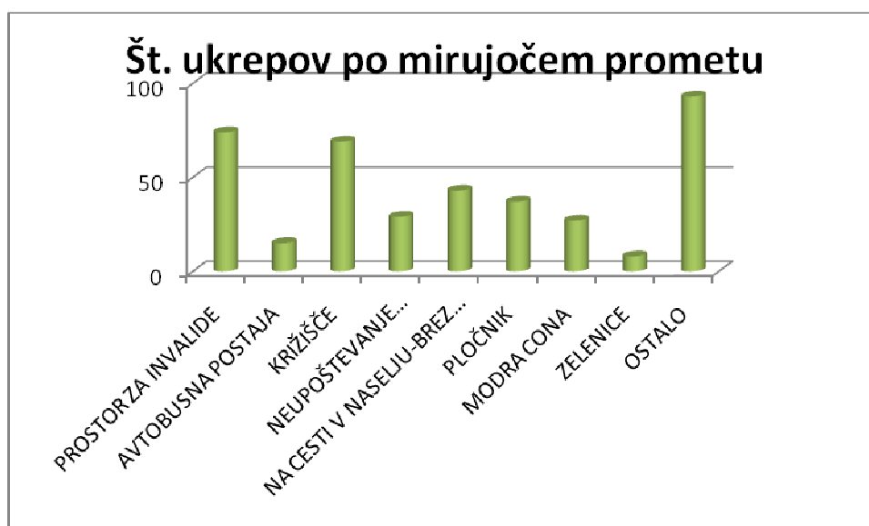
Slika št. 4: Število ukrepov po mirujočem prometu

Občinski redarji so sodelovali tudi pri zaporah cest ob raznih prireditvah, pri projektih »Varna pot v šolo«, izvajali skupne naloge s policijo ter sodelovali z republiškimi inšpektorati.