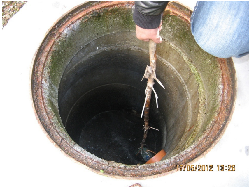
Slika 7: Preverjanje priključitev na javno kanalizacijsko omrežje.