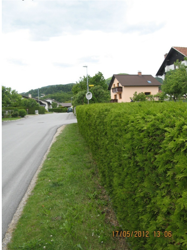
Slika 4: Ovirana preglednost ob občinski cesti.

V okviru varstva cest in udeležencev cestnega prometa smo pregledovali tudi razraščeno živih mej in drugega rastlinja v varovalnih pasovih občinskih cest. Prav tako smo sodelovali pri prometnih ureditvah, podajali smo predloge in pripombe na odvečno, pomanjkljivo ali neustrezno prometno signalizacijo, ki smo jo pri opravljanju vsakodnevnih nalog opazili.