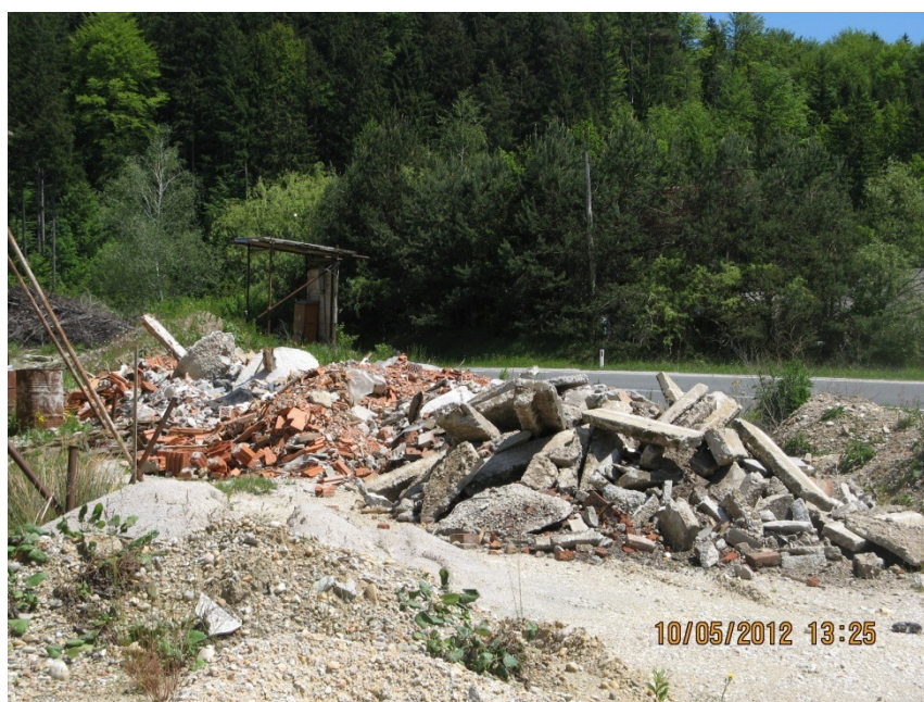
Slika 6: Neurejeno zemljišče ob javni cesti.

Glede na dejstvo, da občino obišče veliko turistov, smo se z opozarjanjem lastnikov neurejen okolice in objektov trudili, da ne izgubi slovesa lepo urejen občine.