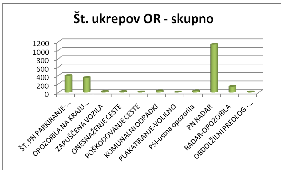
Slika št. 3: Število ukrepov občinskih redarjev po vseh občinah