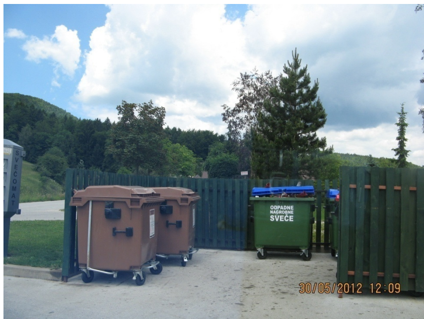
Slika 8: Zgledno urejen prostor za odlaganje odpadkov.

Na območju Občine Zreče se je poostreno izvajal nadzor nad lastniki psov oziroma njihovo uporabo vrečk ter čistilnega pribor za pobiranje pasjih iztrebkov. Nadzor uporabe vrečk se je izvrševal po samem centru, pri jezeru, nogometnem igrišču in na cestah proti Brinjevi gori. Pri tem nadzoru je bilo ugotovljeno, da lastniki psov uporabljajo vrečke in se s tem stanje posledično izboljšuje. Ob opravljanju tega nadzora je bilo izrečenih devet opozoril.