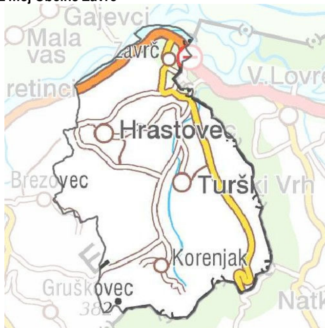
Slika 3: Grafični prikaz mej Občine Zavrč