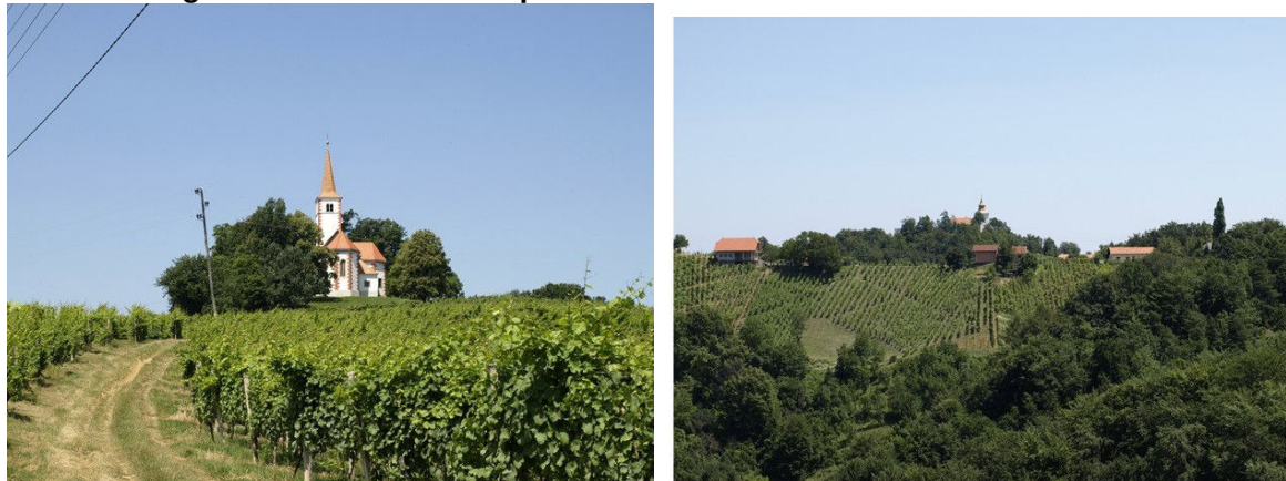
Slika 2: Vinogradništvo in vinorodni predeli Haloz

Na najvišje ležeči točki v Občini Zavrč, na Švabovem, si lahko pogledate območje Občine Zavrč iz nadmorske višine cca 400 m in uživate ob lepem razgledu in naravnem okolju.