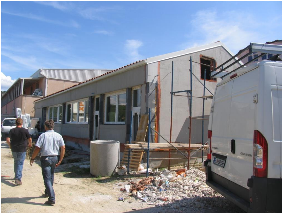
Montaža sanitarne opreme in elementov prezračevanja in ogrevanja.