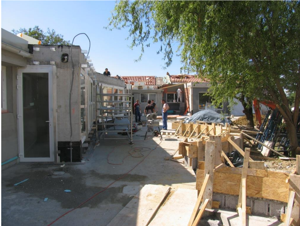
Nova Esal fasada prizidav in dozidave vrtca.