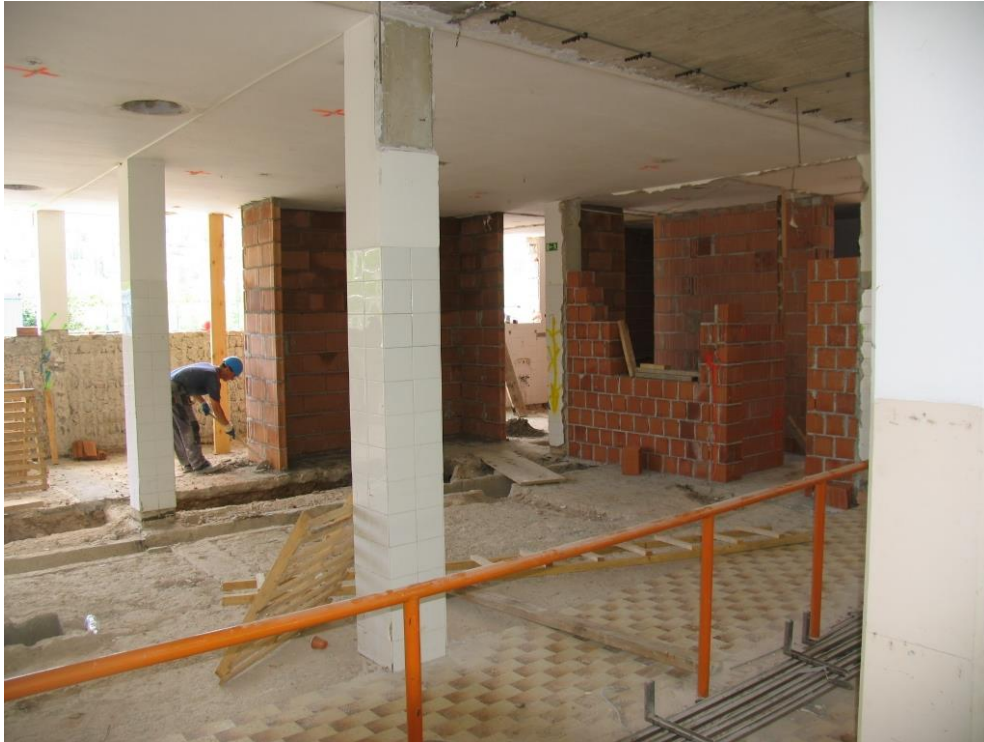
Razpeljava instalacijskih vodov ogrevanja.