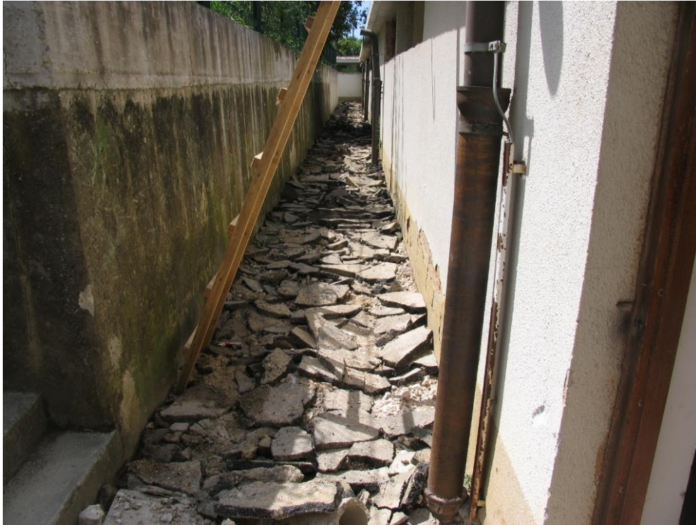
Ponovno urejanje odpadne kanalizacije v objektu.