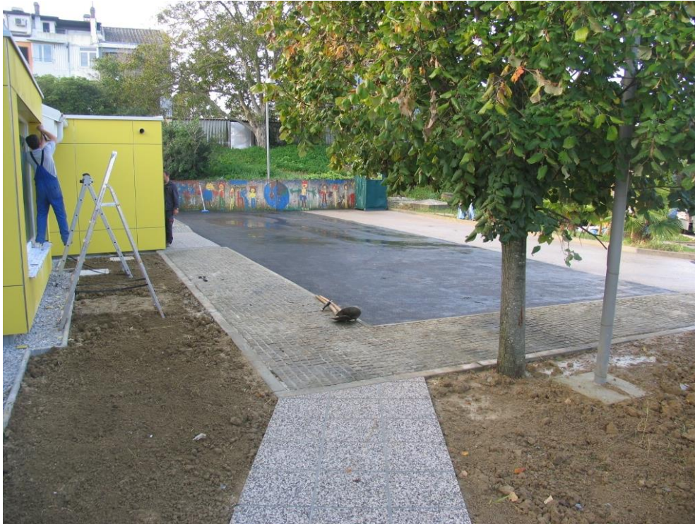
Pogled iz višine na končani vrtec.