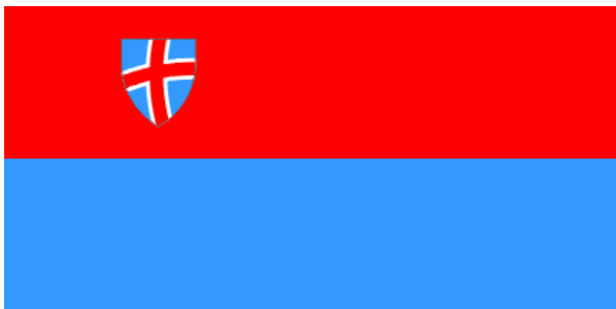
Zastava Občine Piran