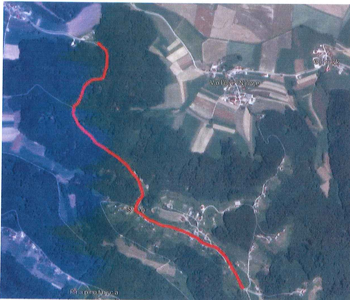
Slika 3: Prikaz umeščenenosti investicijskega projekta v ožje območje