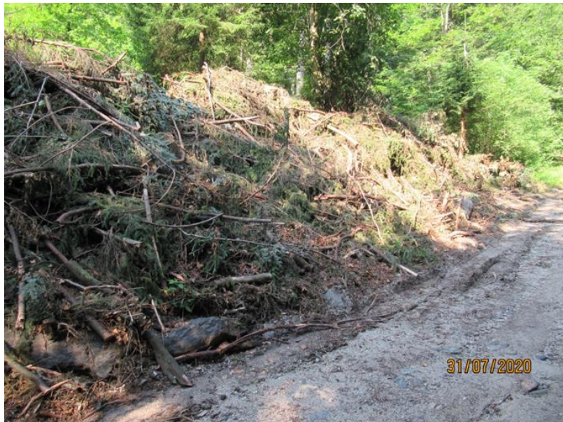
Slika 1: Ostanke sečnje v cestnem svetu, poškodbe cestišča

Problem ostaja predvsem tam, kjer kategorizirana občinska cesta še vedno poteka po zemljiščih v zasebni lasti, saj so v teh primerih nemočni.