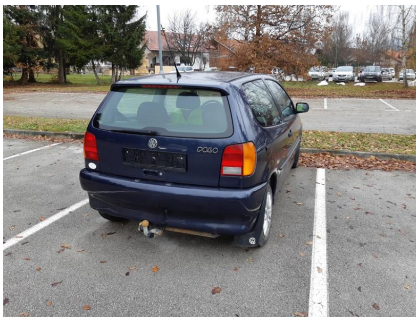
Slika 3: Zapuščeno vozilo na javnem parkirišču

Na področju zapuščenih in izrabljenih vozil so v letu 2020 obravnavali 3 primere, kjer so lastniki po izdani odredbi vozila sami odstranili.