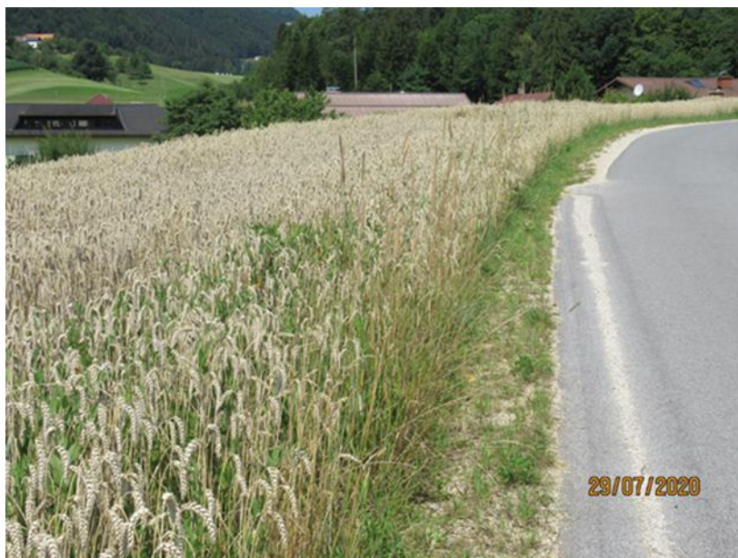
Slika 2: Obdelava zemljišča v cestnem svetu

Na področju zapuščenih in izrabljenih vozil so v letu 2020 obravnavali 3 primere, kjer so lastniki po izdani odredbi vozila sami odstranili.