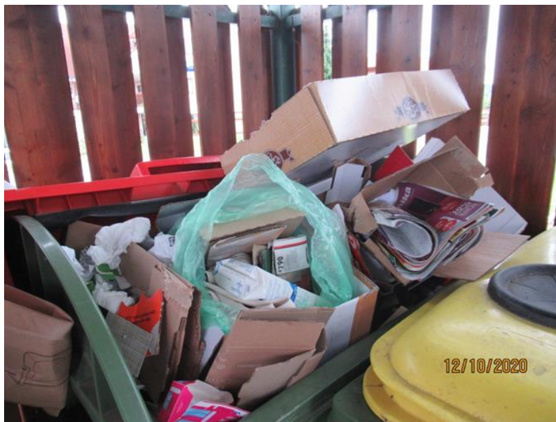
Slika 4: Nepravilno odložena embalaža in PVC med papirjem

Problem neupoštevanja pravil ločenega zbiranja komunalnih odpadkov se pojavlja predvsem pri večstanovanjskih objektih. V letu 2020 so izvedli preventivno akcijo v Zrečah, ki jo bodo letos ponovili. Nova divja odlagališča v naravnem okolju se skoraj ne pojavljajo več, redke posamezne primere uspešno rešujejo.