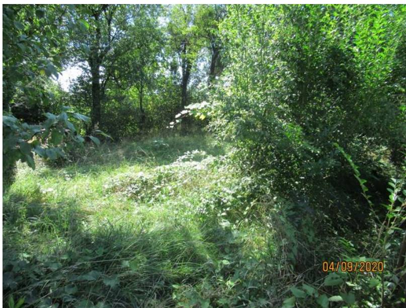
Slika 5: Neurejeno stavbno zemljišče v Zrečah