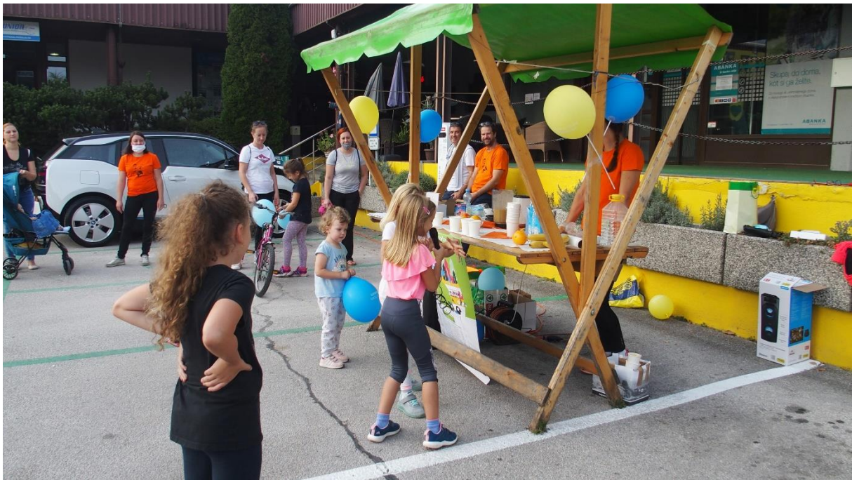
(Evropski teden mobilnosti, september 2020)