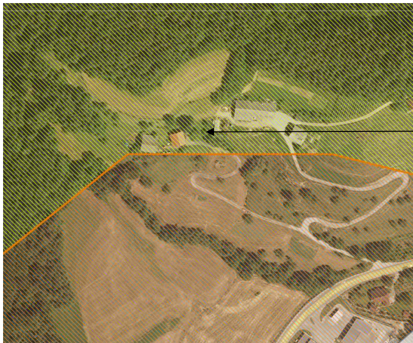
Slika 4: Prikaz erozijskih območij