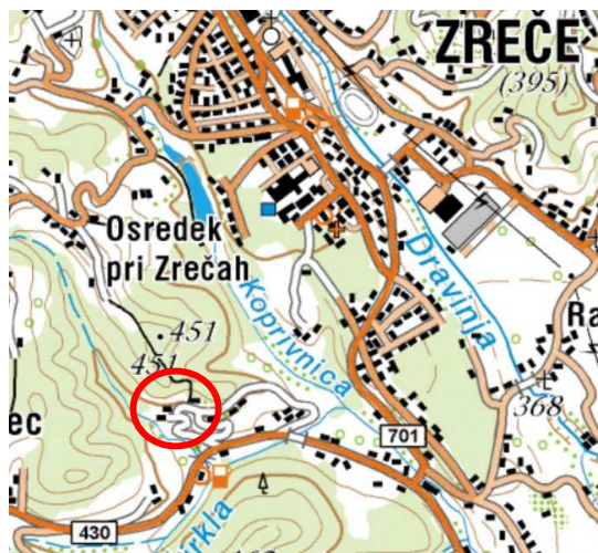
Slika 2: širši prikaz v prostoru – topografija (vir: www.geopedia.si )