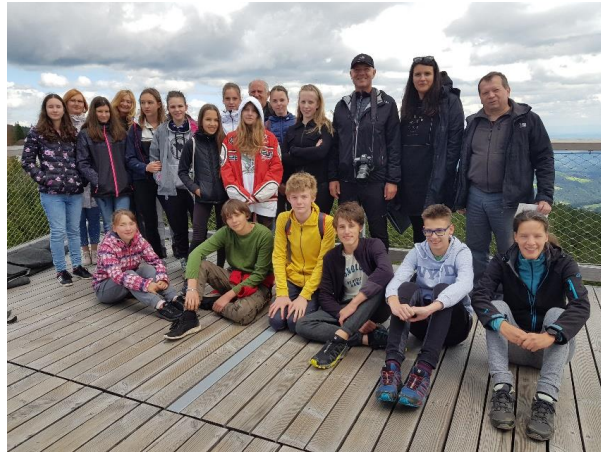
Slika 2: Udeleženci lanskega tabora Rogla 2020

V teku pa so tudi prizadevanja, da k sodelovanju za organizacijo in izvedbo tabora povabimo še Občini Mislinja in Vitanje.