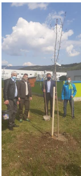
Slika 3: Zasaditev drevesa