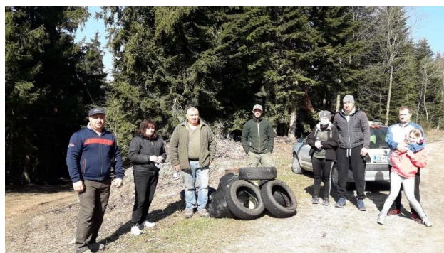
Slike 7, 8 in 9: Utrinki s čistilne akcije