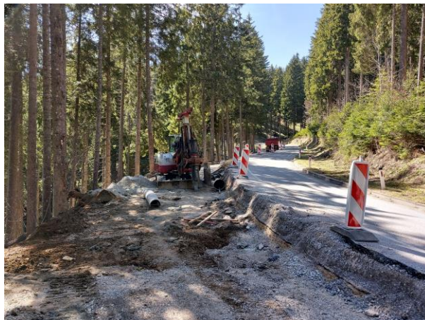
Slika 6: Sanacija usada

1. Plaz 6,00 km: Pogodba podpisana z izvajalcem GAL Podčetrtek v vrednosti 262.000 €. V marcu je bila izvedena uvedba v delo. Izvajalec je pričel z deli, ki jih mora končati do 5. 11. 2021, vendar se planira zaključek še pred jesenjo 2021.