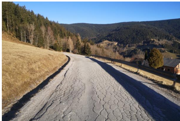
Slika 5: Odsek ceste LC 460044 februarja 2021

Na osnovi nje smo trenutno v fazi javnega razpisa za izbiro izvajalca del.