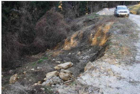
Slika 4: Plaz kmalu po sprožitvi

Dne 22. 4. 2021 smo pričeli z zbiranjem ponudb za izbor izvajalce. V pozivu, ki smo ga poslali trem izvajalcem, smo pozvali k oddaji ponudb, ki morajo biti oddane do 7. 5. 2021 do 12. ure. Po izboru najugodnejšega izvajalca, bomo sklenili pogodbo in pričeli s sanacijo, ko bodo vremenske razmere ugodne.