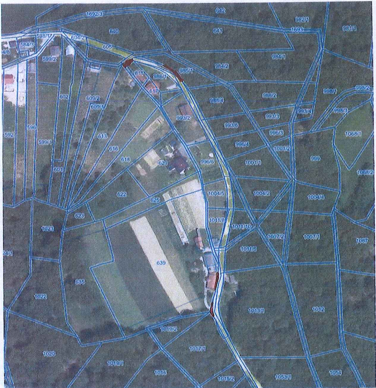
Lokacije parcel, za katere se predlaga ukinitvev statusa grajenega javnega dobra