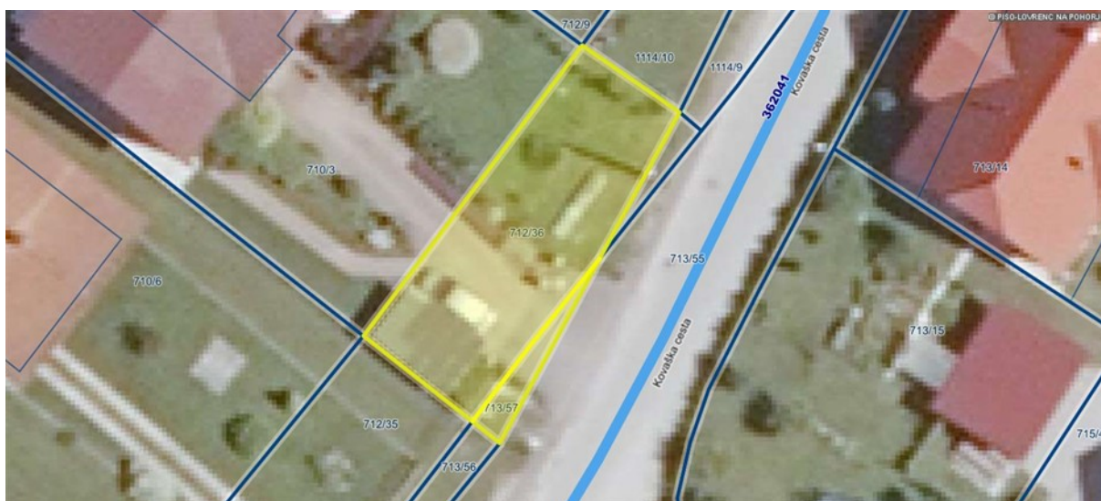
Izris iz zemljiškega katastra za nepremičnino pod zap. št. 7 in