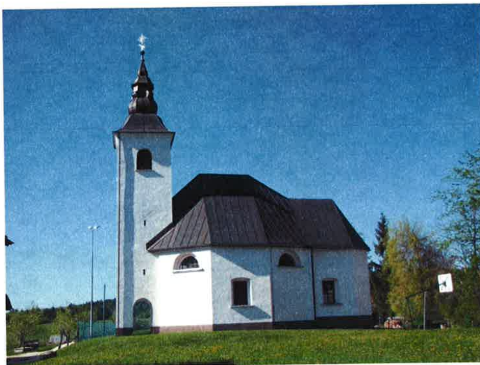
Cerkev svetega Petra na Studencu je bila obnovljena v letih 2014 in 2015.