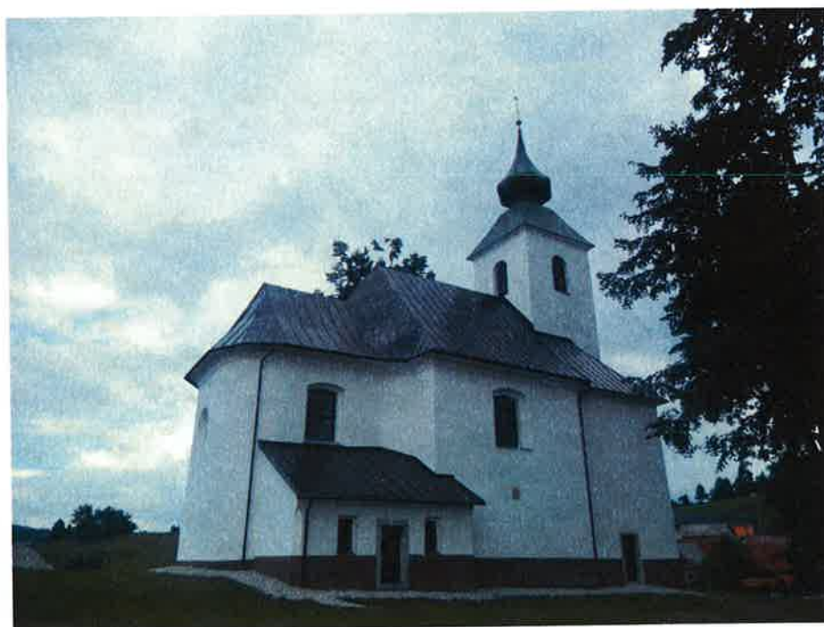
Cerkev Sveti Duh je bila obnovljena leta 2015.