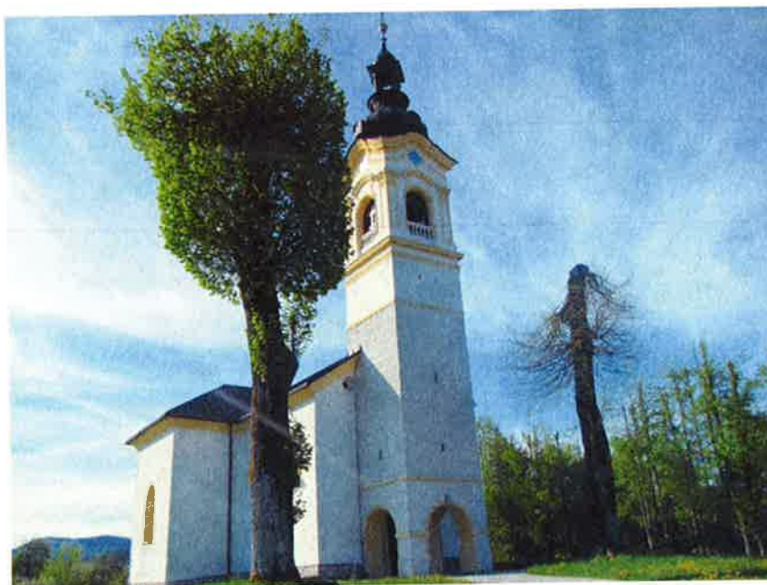
Cerkev sv. Antona Padovanskega v Metuljah je bila obnovljena leta 2010.