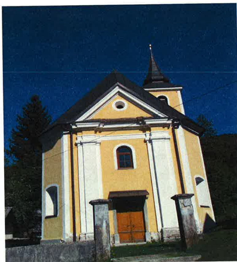
Cerkve sv. Filipa in Jakoba v Ravnah na Blokah je bila obnovljena leta 2012.