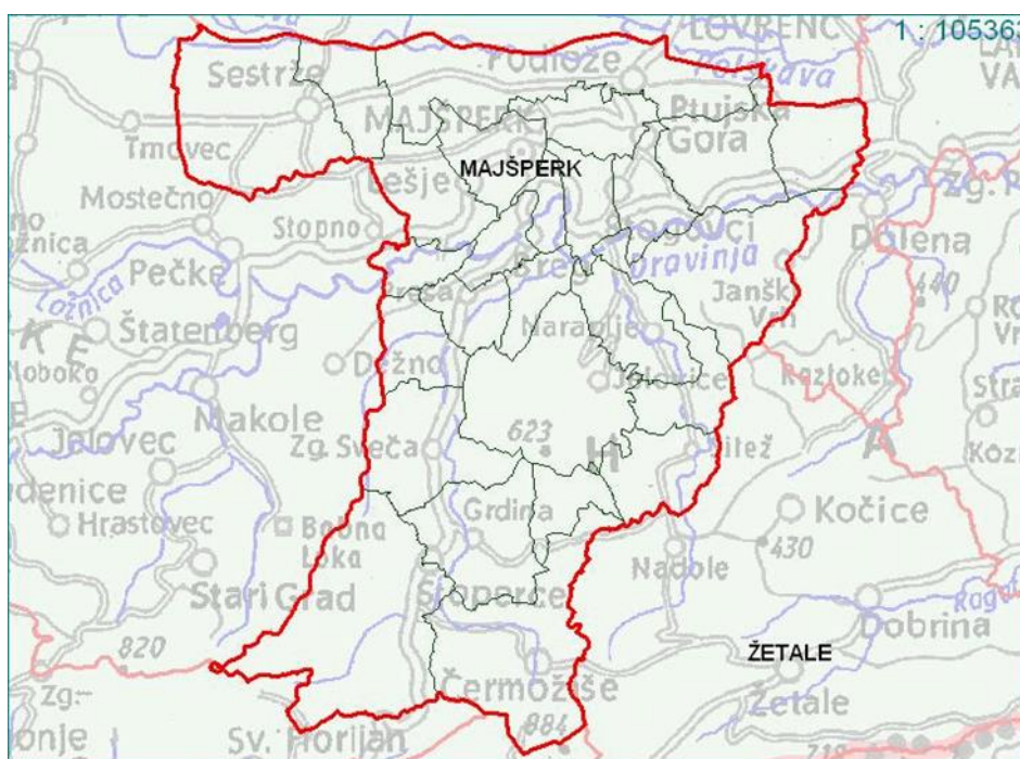
Slika 1: Zemljevid občine Majšperk