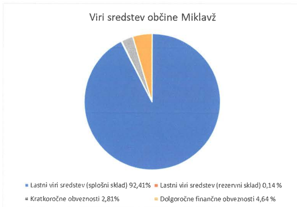
Graf 4: Viri sredstev na dan 31.12.2019