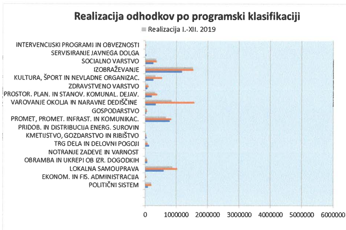
Graf 3: Prikaz realizacije odhodkov proračuna po programski klasifikaciji

Najpomembnejše zastavljene naloge na področju investicij so bile v letu 2019 naslednje: