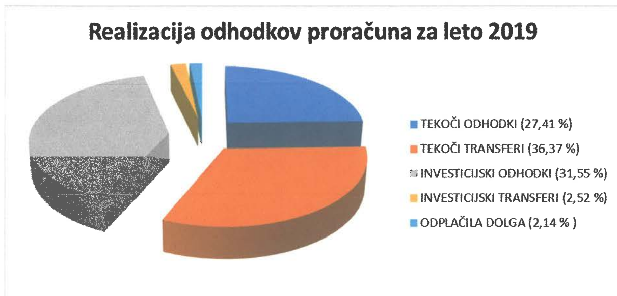
Graf 2: Realizacija odhodkov proračuna v letu 2019