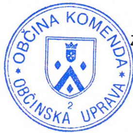
Župan Občine Komenda Stanislav Poglajen

Stroške izdelave SD LN št. 2 krijejo pobudniki. Občina pa zagotavlja vodenje postopka in sprejem dokumenta.