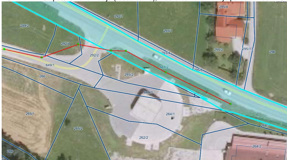
Slika 1: Prikaz poteka kanalizacije (rdeča barva); modra barva označuje parcelo v lasti RS