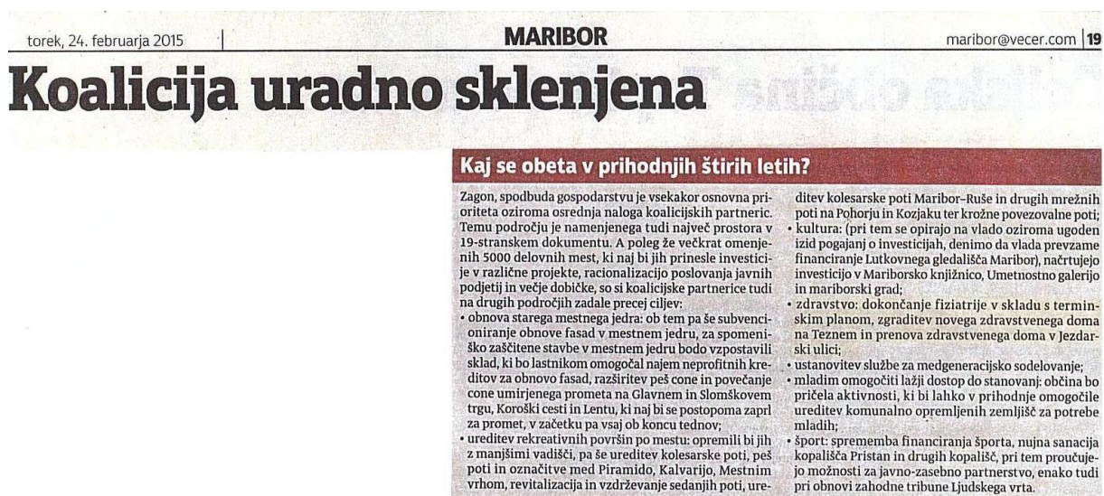
Slika 1: Večer, 2015, 24. 2., str. 19

Mestna občina Maribor je dne 23. 2. 2015 uradno sklenila koalicijsko pogodbo za obdobje 4 let. V koalicijski pogodbi so se partnerji med drugim zavezali, da se bo v skladu s terminskim planom dokončala fizioterapija, da se bo zgradila nova zdravstvena postaja na Teznem in prenovila zdravstvena postaja v Jezdarski ulici.