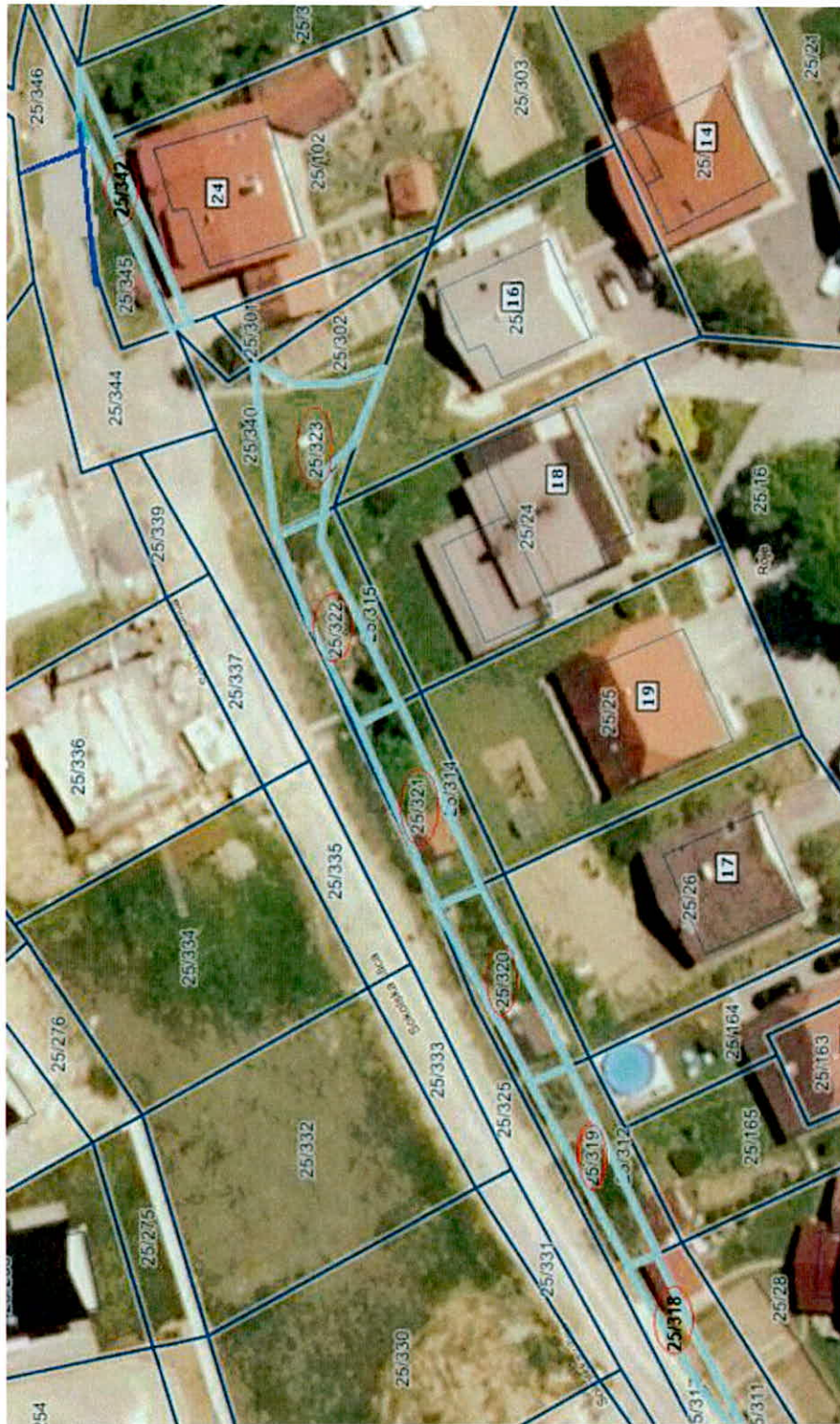
Parcelle: 25/318, 25/319, 25/320, 25/321, 25/322, 25/323, 25/342