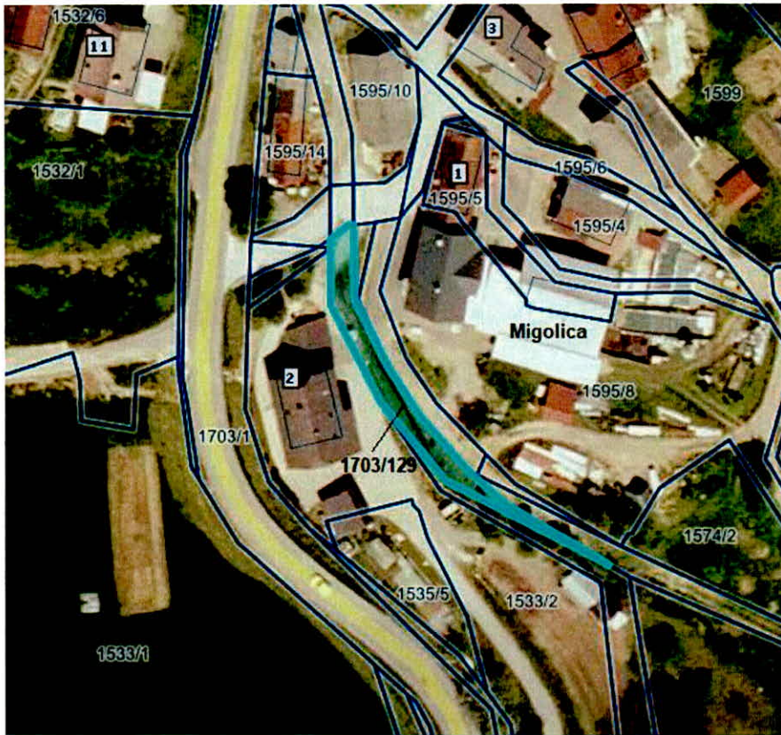
Parcela 1703/129, Migolica