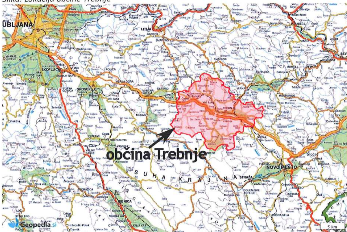
Slika: Lokacija občine Trebnje