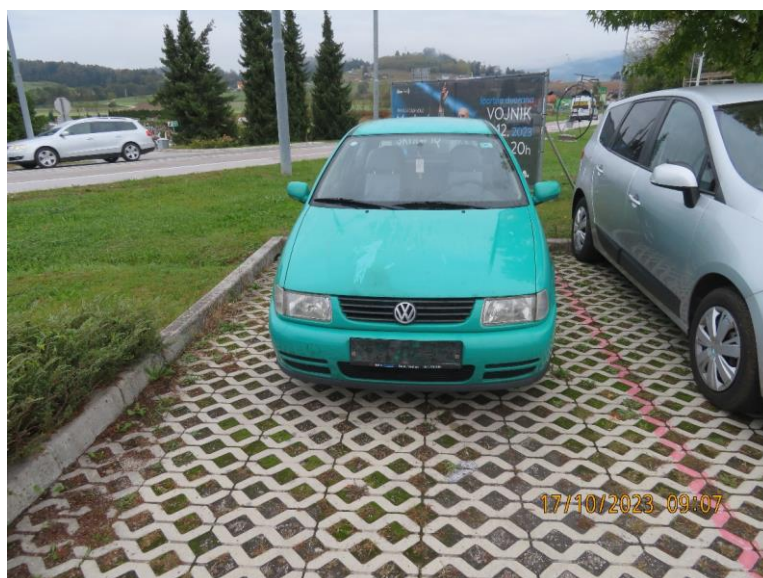
Napačno parkirano vozilo / zapuščeno vozilo