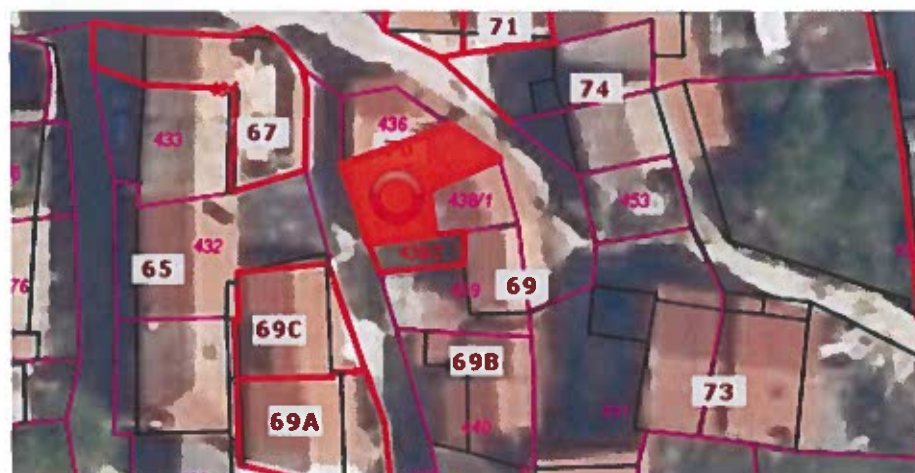
Parc. št. 437 k.o. Nova vas, izmere 40 m 2