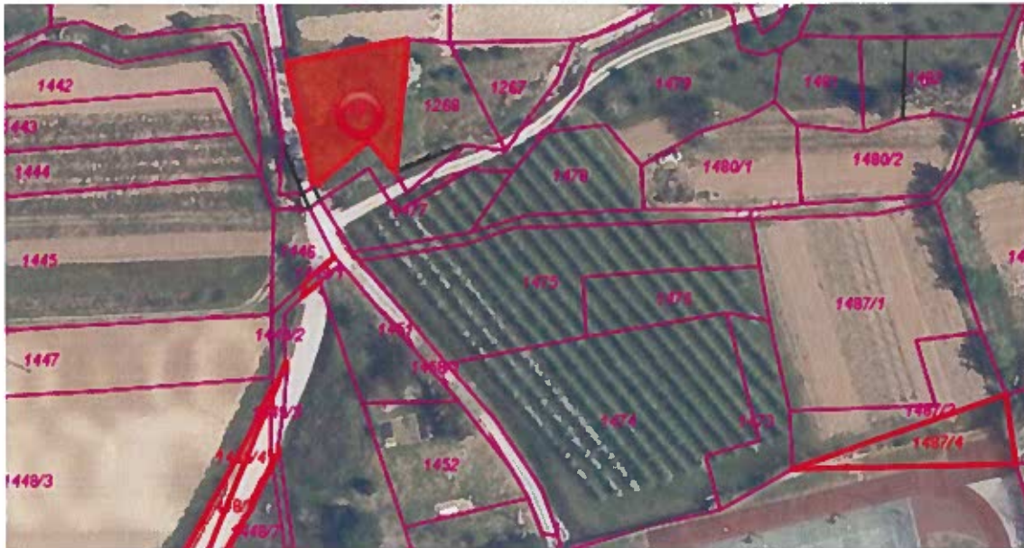
Parc. št. 1269 k.o. Sečovlje, izmere 627 m 2