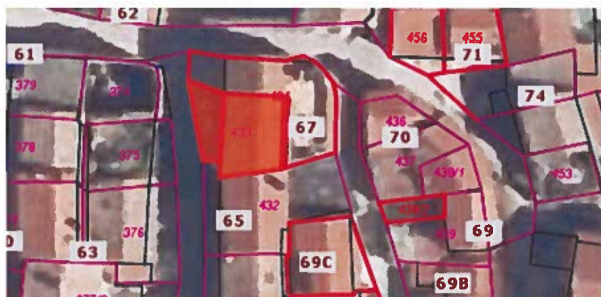
Parc. št. 433 k.o. Nova vas, izmere 60 m 2