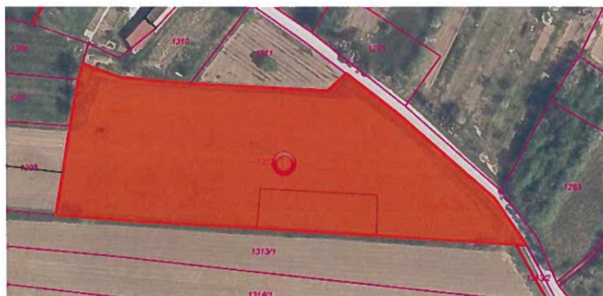
Parc. št. 1312 k.o. Sečovlje, izmere 5.551 m 2