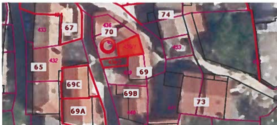
Parc. št. 438/1 k.o. Nova vas, izmere 21 m 2