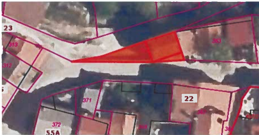
Parc. št. 364 k.o. Nova vas, izmere 77 m 2