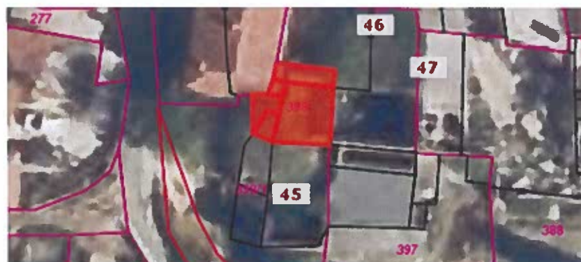
Parc. št. 398 k.o. Nova vas, izmere 43 m 2