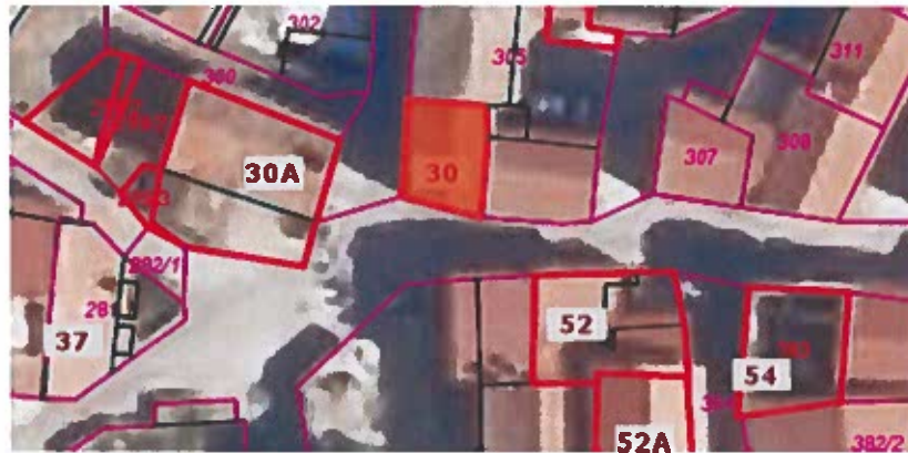
Parc. št. 304 k.o. Nova vas, izmere 29 m 2