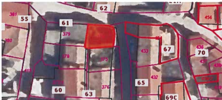
Parc. št. 374 k.o. Nova vas, izmere 44 m 2