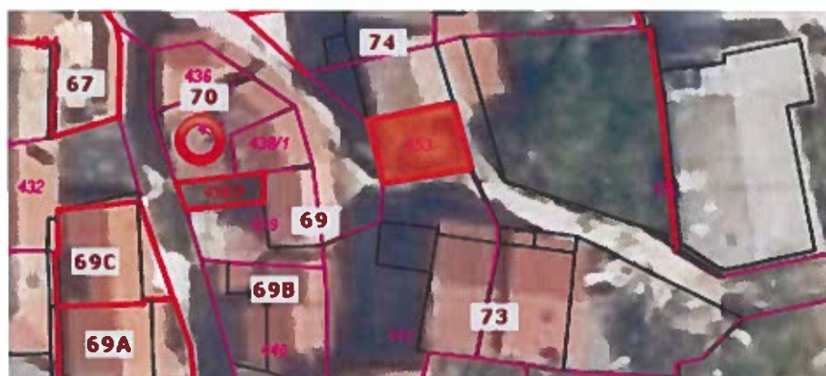
Parc. št. 453 k.o. Nova vas, izmere 32 m 2