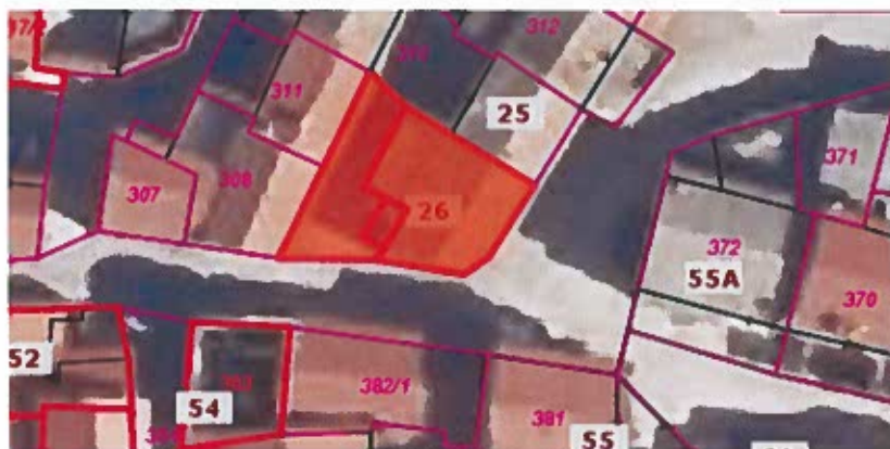
Parc. št. 309 k.o. Nova vas, izmere 100 m 2