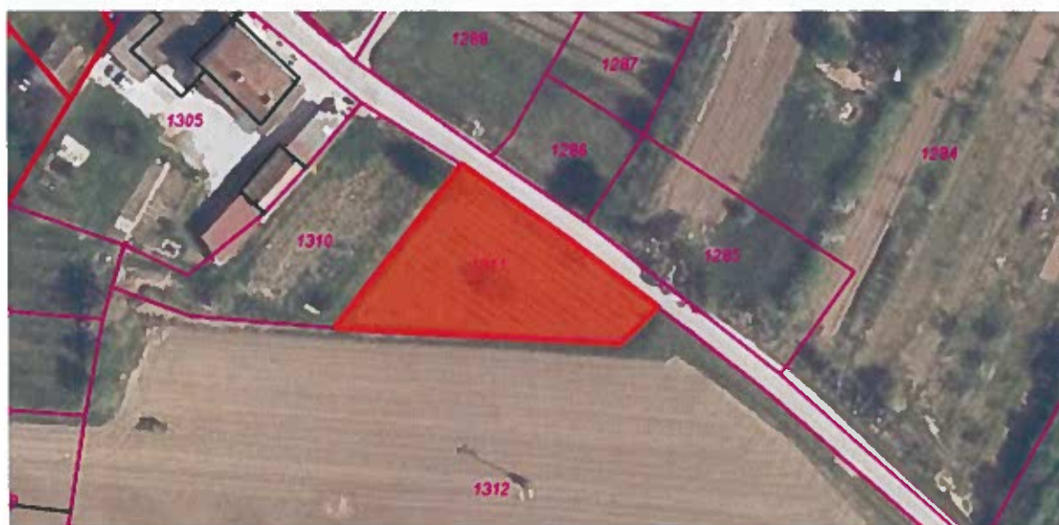
Parc. št. 1311 k.o. Sečovlje, izmere 710 m 2