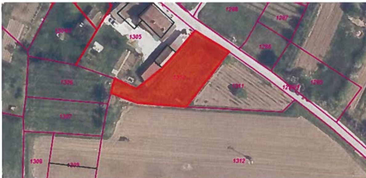
Parc. št. 1310 k.o. Sečovlje, izmere 784 m 2