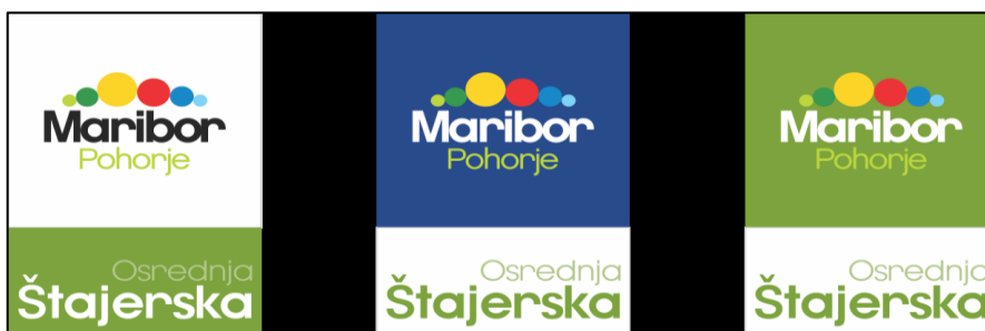
Slika 4: Krovna tržna in destinacijska znamka Maribor - Pohorje - Osrednja Štajerska.

Posamezne blagovne znamke sebestinacij (območja občin na Dravskem polju in v Slovenskih goricah), kamor spada tudi turistična destinacija Občine Starše, še niso oblikovane. Sprejeta je samo obveza, da se bodo subdestinacijske blagovne znamke vedno uporabljale skupaj s krovno znamko.