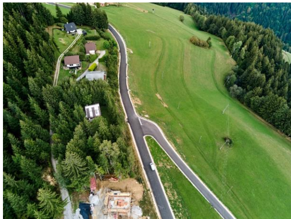
Slika 1: Moderniziran odsek LC v Skomarju

Končna vrednost gradbenih del, skupaj s podražitvijo, je znašala 516.641,35 €, brez podražitve pa 475.160,90 €. Stroški nadzora, varnostnega načrta in koordinatorja so znašali 23.805,86 €. Predhodni stroški geodetskega načrta, dveh projektnih dokumentacij PZI in priprave podatkov za odmero ter odmera so znašali 27.988,76 €. Vsi stroški skupaj so bili v višini 568.435,97 €.