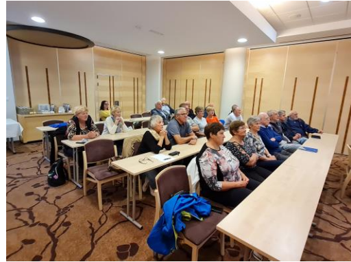
Sliki 8 in 9: utrinka s predavanja »Sožitje za večjo varnost v cestnem prometu«

Pripravila: Simona Črešnar, višja svetovalka za cestno gospodarstvo