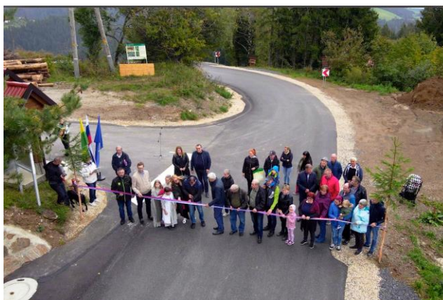
Slika 2: Prerez traku

Pripravil: Andrej Furman, vodja projekta