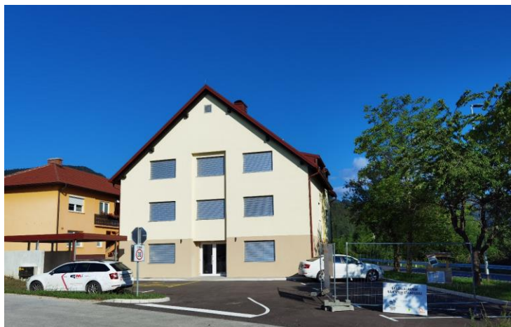
Slike 5, 6 in 7: Nov stanovanjski objekt na Mladinski ulici

Pripravila: Milena Slatinek, višja svetovalka za gospodarske dejavnosti