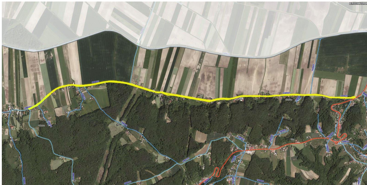
Slika 7/1: Trasa obnove cestišča

Območje posega na parcelne številke 1238, 1242/1 in 884, vse k.o. Sestrže v lasti Občine Majšperk.