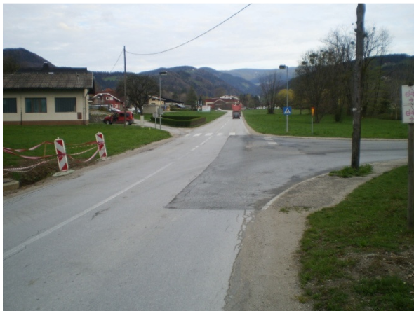
Slika 1 (BRGLEZ)