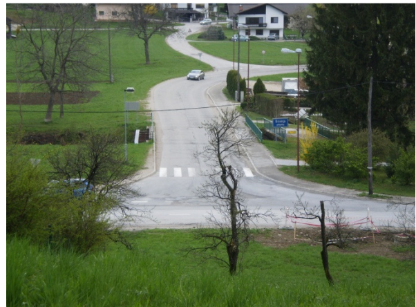
Slika 2 (BRGLEZ)