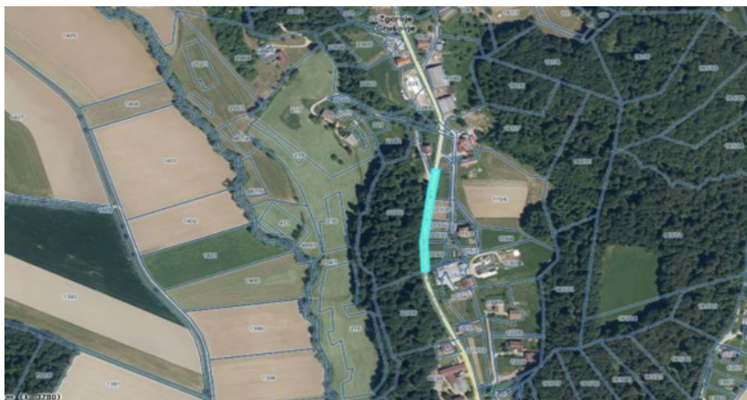
6. Parc.št. 269/7 k.o. 760-Koritno