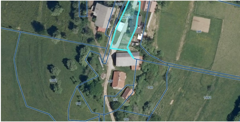
4 Parc.št. 1285/2 k.o. Zgornje Grušovje