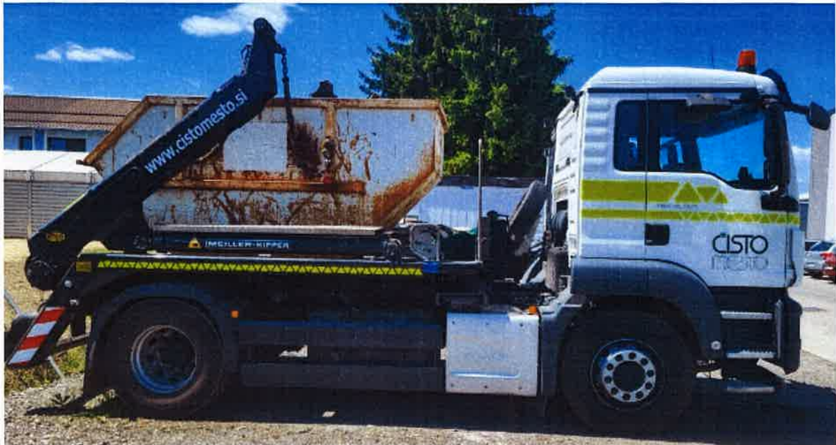
Fotografija 14: Vozilo za prevoz kontejnerjev

Za zbiranje in prevoz odpadkov iz zbirnih centrov, uporabljamo specialna komunalna vozila za odvoz kontejnerjev večjega volumna: