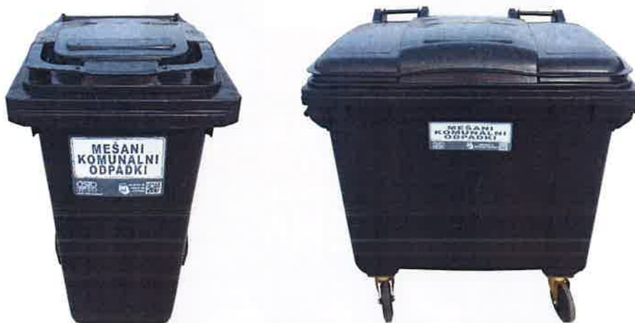
Fotografija 2 in 3: Posode za mešane komunalne odpadke