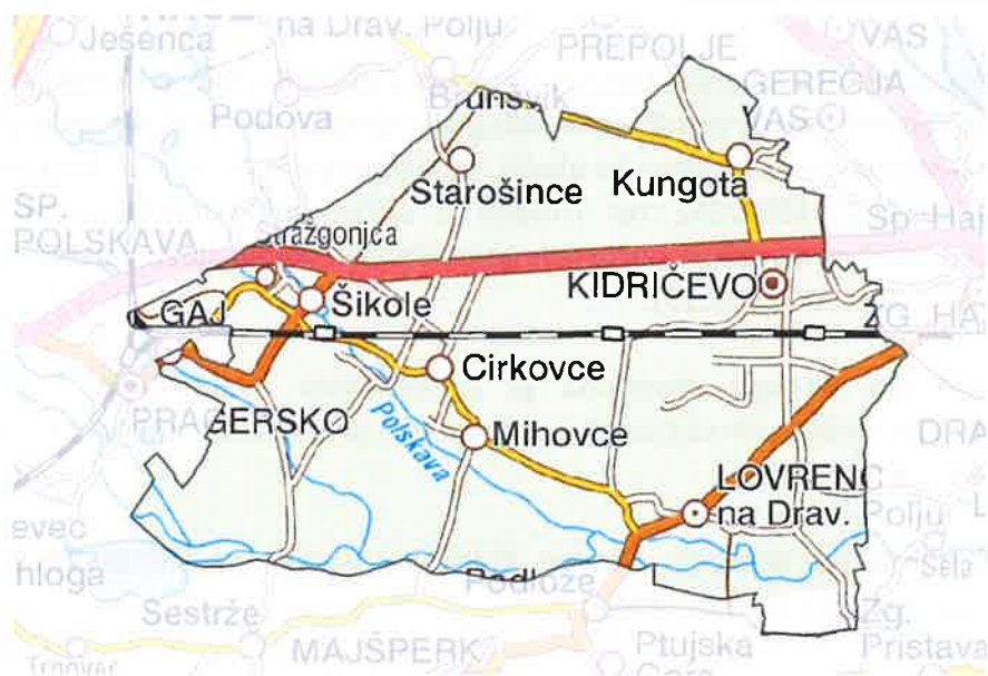
Slika 1: Zemljevid občine Kidričevo