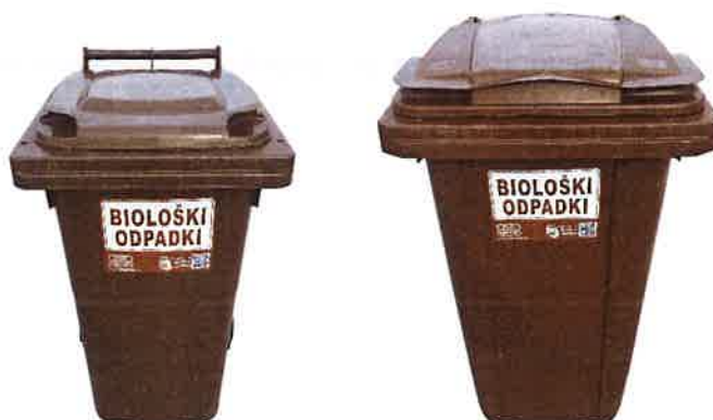
Fotografija 4: Posode za biološke odpadke