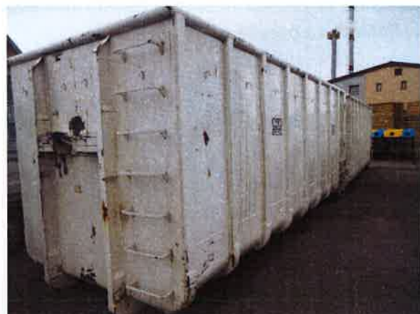
Fotografija 15 in 16: Kontejnerji različnih volumnov za zbiranje kosovnih in drugih odpadkov