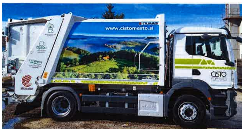
Fotografija 12 in 13: Smetarska vozila