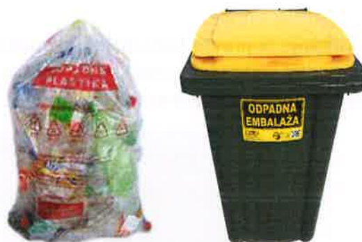
Fotografija 7: Vrečka za mešano embalažo

Za zbiranje steklene embalaže, uporabljamo plastične zabojnike, volumnov 240 l in 1100 l in sicer: