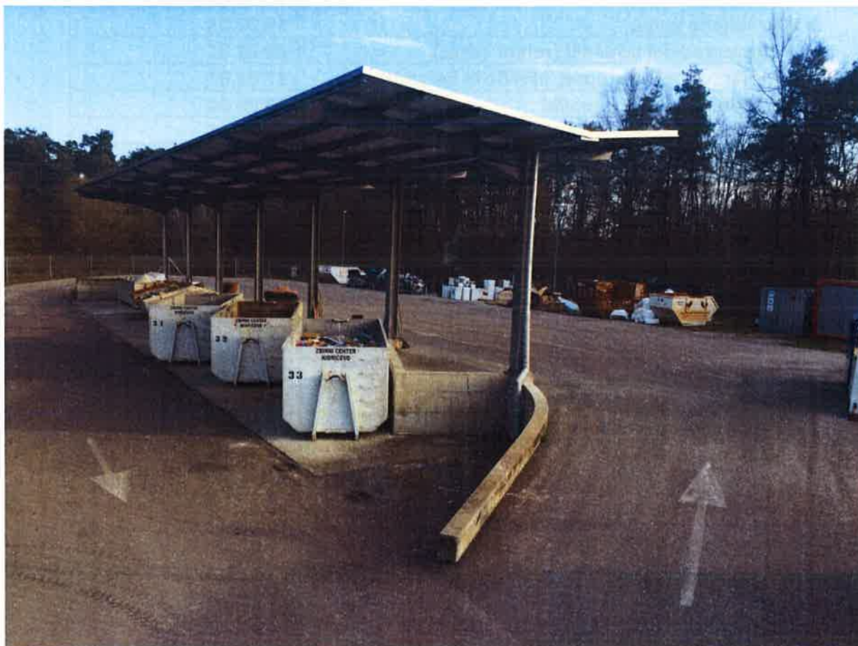
Fotografija 1: Zbirni center Kidričevo

Datumi obratovanja zbirnega centra bodo navedeni na koledarju odvoza odpadkov ter na spletni strani https://cistomesto.si/zbirni-centri/ .