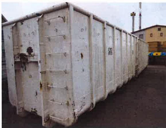
Fotografija 10 in 11: Kovinski kontejnerji