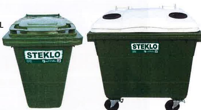
Fotografija 8 in 9: Posode za zbiranje stekla (steklene embalaže)