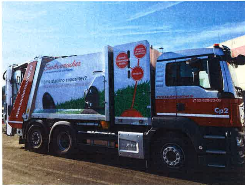
Fotografija 19: Vozilo za pranje zabojnikov za zbiranje bioloških odpadkov