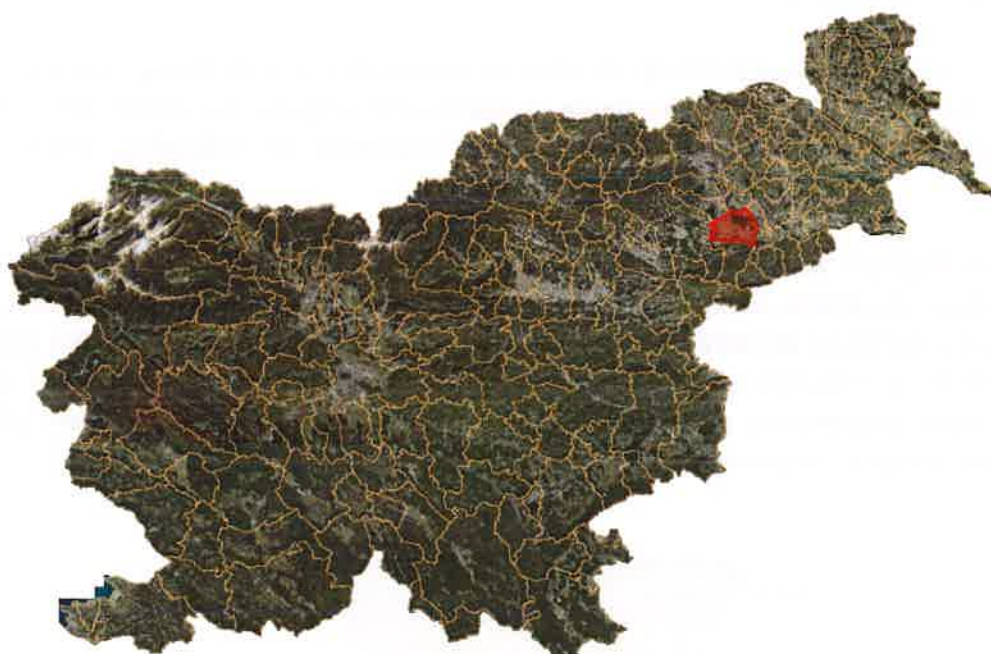
Slika 2: Lega občine Kidričevo