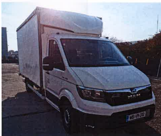
Fotografija 18: Vozila za prevoz in zbiranje nevarnih odpadkov

Za zbiranje in prevoz nevarnih frakcij uporabljamo specialna vozila, s pokritim kesonom in dovoljenjem za prevoz nevarnih snovi.