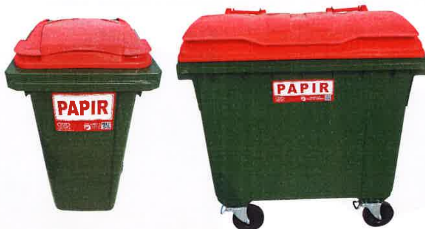
Fotografija 5 in 6: Posode za zbiranje papirja

Za zbiranje plastične embalaže ter ločenih frakcij iz plastike bomo uporabljali: