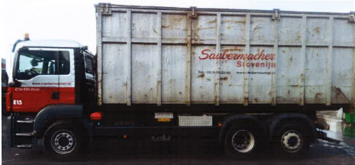
Fotografija 17: Vozilo za prevoz kotalnih prekucnikov

Za prevzemanje in prevoz kosovnih odpadkov uporabljamo kontejnerska vozila ter vozila za prevoz kotalnih prekucnikov.