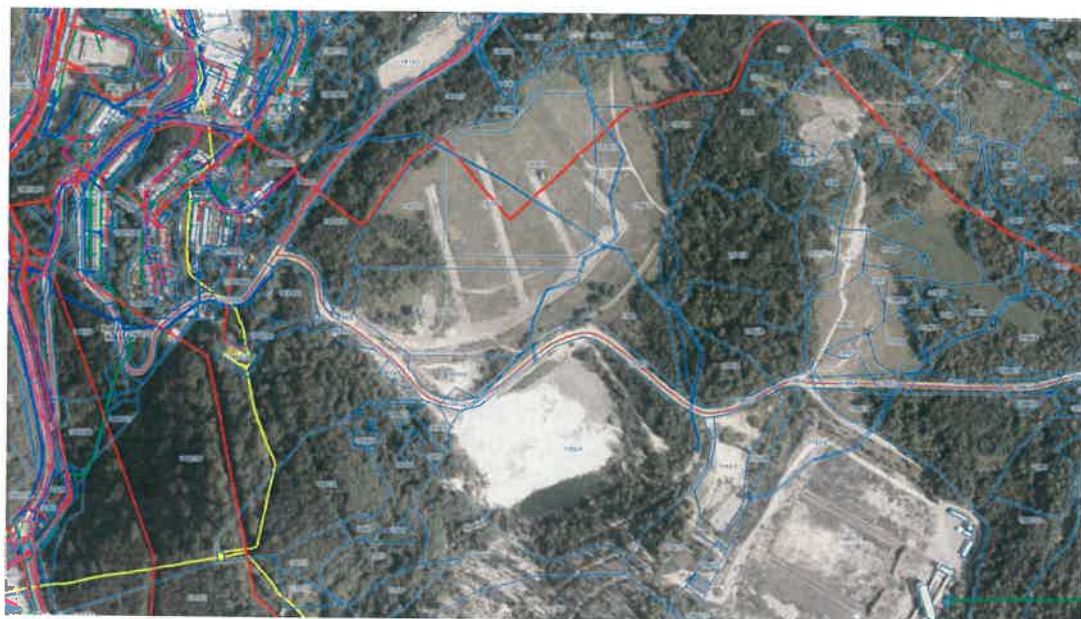
Prikaz poteka obstoječih vodov GJI

Občina Trbovlje bo poskrbela za sanacijo degradiranih površin. V izdelavi je obsežna geološko–geotehnična preiskava tal na platoju, katere rezultat bo program sanacije, ki bo pokazal, na kakšen način se bo zemljišče pripravilo za gradnjo tovarne. Po pripravljenem programu bo Občina Trbovlje sanirala tla tako, da bodo pripravljena na izgradnjo tovarne, pri čemer si bo za pokritje stroškov prizadevala pridobiti sredstva iz Sklada za pravičen prehod premogovnih regij. Omenjeni sklad naj bi pokrival stroške vsaj sanacije degradiranih rudniških površin. Upamo pa, da bo iz sklada mogoče črpati tudi sredstva za komunalno opremljanje zemljišča za namen izgradnje tovarne. Prav tako je pomemben dejavnik časovna komponenta, saj upamo, da bo sredstva mogoče črpati vsaj v letu 2022.