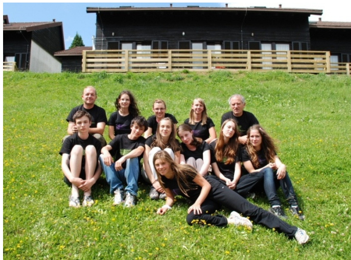
Udeleženi tabora in mentorji

Skupina za svetlobno onesnaženje je največ časa posvetila popisu obstoječe razsvetljave na območju občine Zreče. Ugotovila je, da se stanje počasi izboljšuje, vendar bo potrebno vložiti še veliko napora za bistveno zmanjšanje nepotrebne razišipavanje električne energije, ki jo prebivalstvo porabi za razsvetljavo. Skupina je podala tudi nekaj kratkoročnih ukrepov za izboljšanje stanja tudi na sami Rogli.