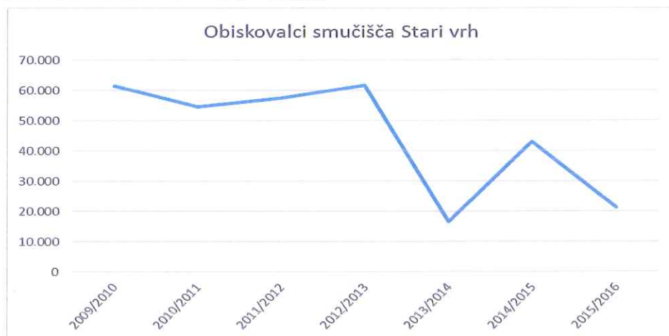
Graf 1: Obisk na smučišču Stari vrh 2009/10 – 2015/16

Graf prikazuje število smučarjev po sezonah.