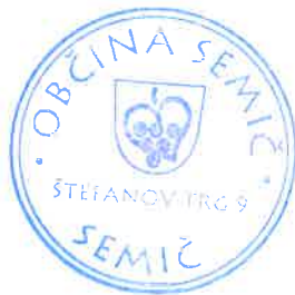
Polona Kambič, županja

Številka: 410-10/2016 Datum: 15. 5. 2017