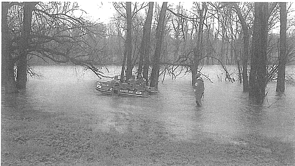
Reševanje na vodi