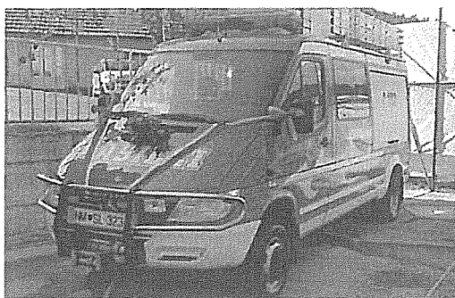
vozilo GVV-1 PGD Sinji Vrh

Omeniti je potrebno tudi investicije v gasilske domove in sicer je bil sofinanciran prizidek k gasilskemu domu Črnomelj, delno sofinancirana obnova gasilskega doma PGD Adlešiči, PGD Dobljče, PGD Dragatuš, PGD Rodine in PGD Učakovci - Vukovci.