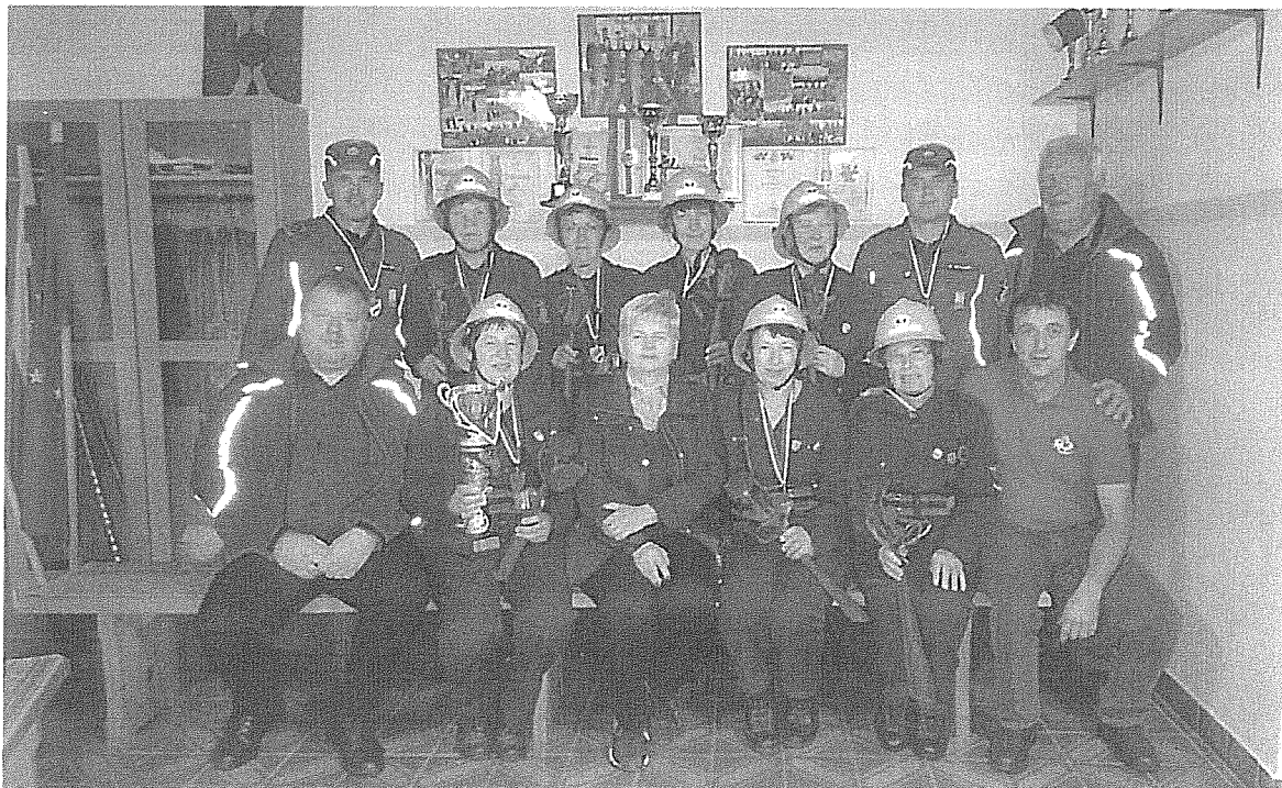
Starejše gasilke PGD Petrova vas

V sklopu Pokala belokranjske regije je bilo izvedeno šest tekem, na pokalu so sodelovale 5 (3) ekip iz GZ Črnomelj, ki so uspešno zaključile tekmovanje in sicer starejši gasilci iz PGD Dragatuš 6 mesto, starejši gasilci PGD Petrova vas 4 mesto, članice PGD Vranoviči 3 mesto, starejše gasilke PGD Petrova vas 2 mesto. Na območju gasilske zveze Črnomelj sta bila tekmovanja izvedena v PGD Vranoviči in PGD Petrova vas.