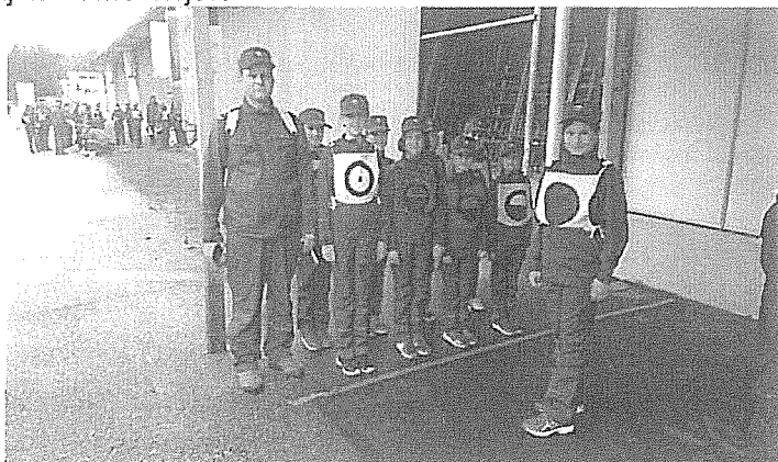
Pionirke PGD Griblje na državnem tekmovanju Gornja Radgona 2018

Pri GZ Črnomelj si želimo še več tekmovalnih ekip, ki bi dosegale vidne rezultate, pri tem pa je potrebno pohvaliti dosežene rezultate v letu 2018 se so bili doseženi s trdim delom vseh članov ekip in njihovih mentorjev.