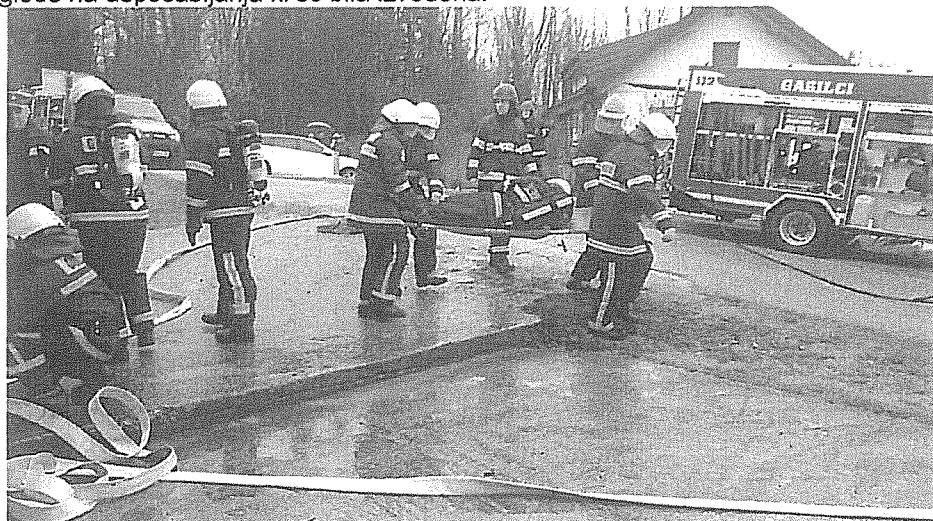
Operativni pregled PGD Žuniči

Za preverjanje usposobljenosti operativnih enot je bil zveden operativni pregled 2018, ki ga je uspešno opravilo vseh 27 enot. Odlično ocenjene enote so bile PGD Talčji Vrh, Črnomelj, Zilje, Tribučje, Stari trg ob Kolpi, Rožič Vrh, Adlešiči, Rodine, Petrova vas, Vranoviči in Vinica. Prav dobro je bilo ocenjenih deset enot in dobro šest enot. Kot kaže se znanje v enotah povečuje kar je spodbudno in pričakovano glede na usposabljanja ki so bila izvedena.