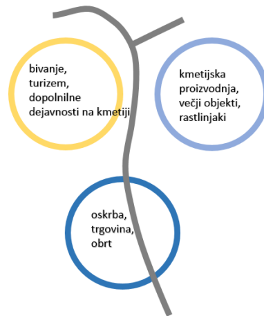
Slika 1: Koncept razvoja prostora