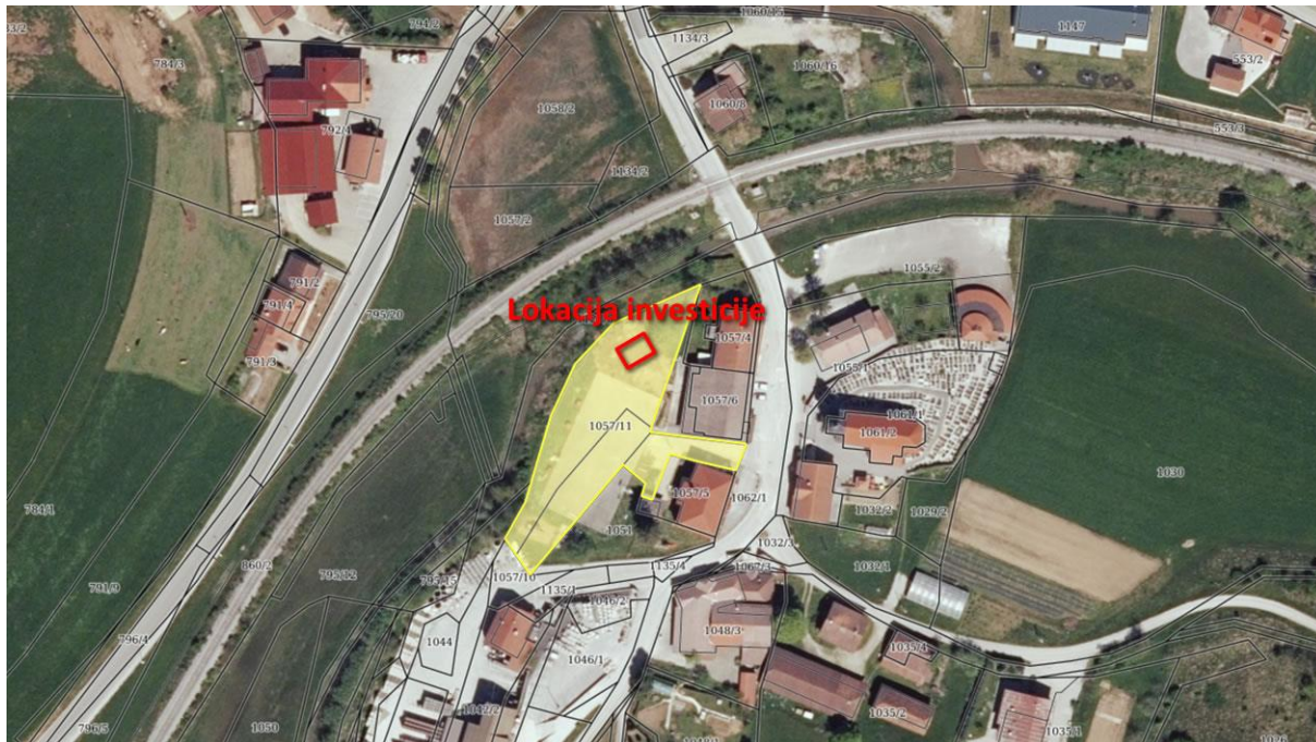
Slika 3: Lokacija investicije na ortofotu posnetku

Vir: Eterra, https://eterra.si/ , november 2022