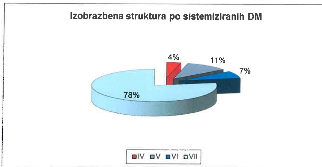
Graf št. 1: Izobrazbena struktura po sistemiziranih delovnih mestih v občinski upravi Občine Trbovlje