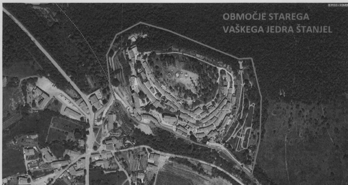
Grafična priloga št.1: območje urejanja cestnega prometa v starem vaškem jedru v Štanjelu.