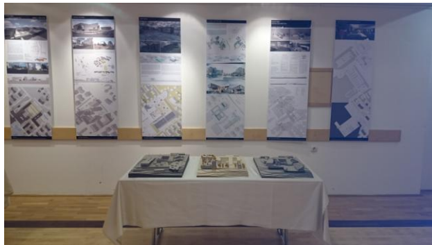
Slika 1: Razstava

Izdelani scenariji so rezultat intenzivnega sodelovanja Univerze v Mariboru in FGPA z Občino Zreče na podlagi sklenjenega Sporazuma o sodelovanju na področju trajnostnega in družbeno odgovornega razvoja regije. Razstavo scenarijev si je možno ogledati v Kulturnem domu Zreče do 30.4.2016. V okviru projekta pa je bila tudi izdana publikacija, ki prikazuje vseh enajst izdelanih scenarijev.