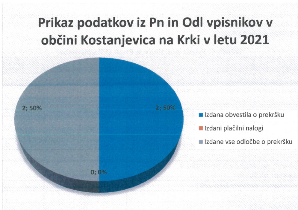
Graf 2: Prikaz podatkov iz Pn in Odl vpisnikov za leto 2021