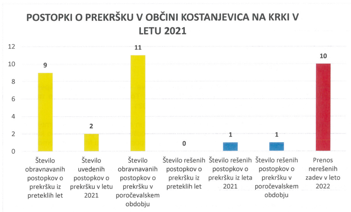
Graf 1: Prikaz podatkov iz Pn in Odl vpisnikov za leto 2021