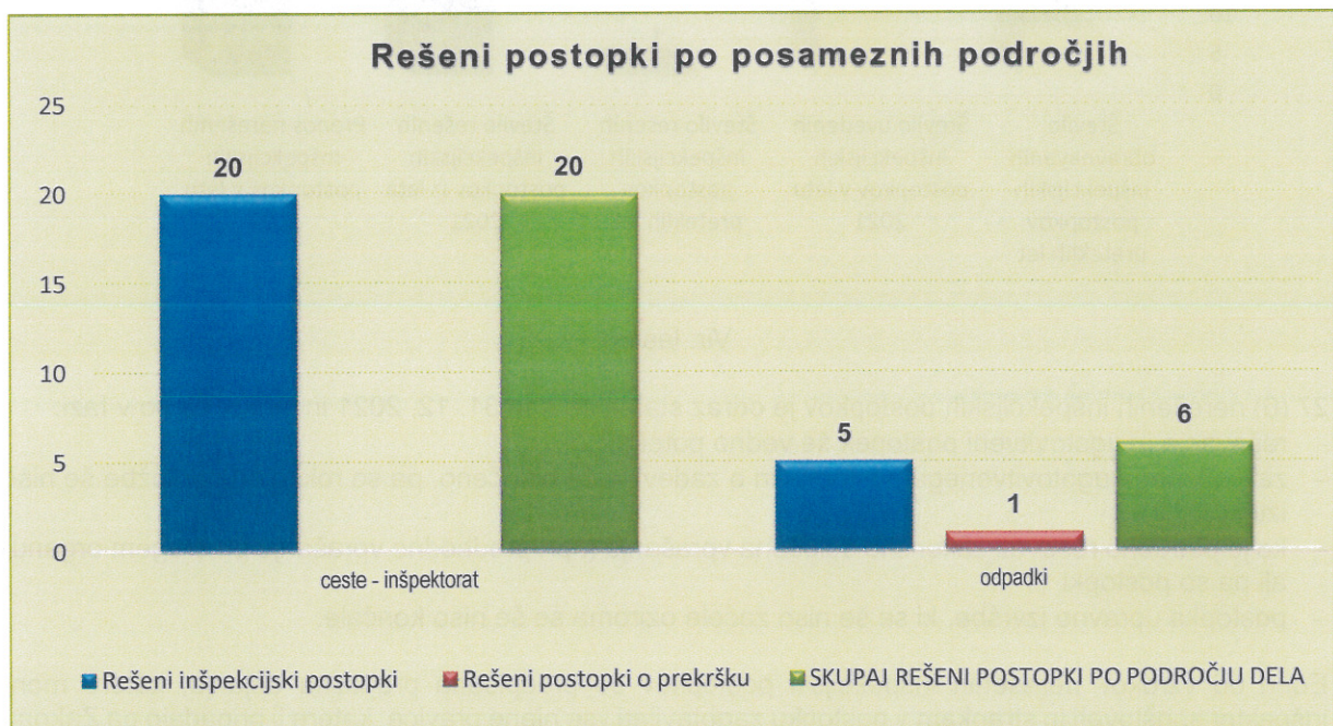
Graf 4: Število rešenih postopkov po posameznih področjih

Predstavljamo vam posamezne ugotovitve nadzora po posameznih področjih rešenih zadev.