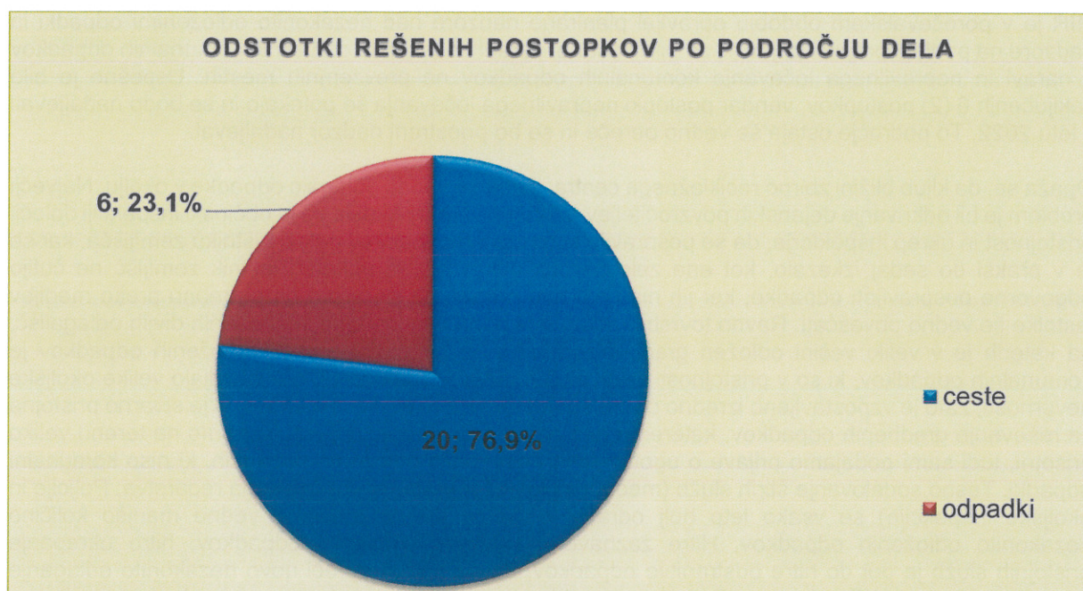
Graf 5: Odstotki rešenih postopkov po področju dela