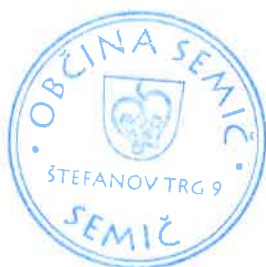
Polona Kambič, županja