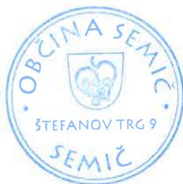
Polona Kambič, županja