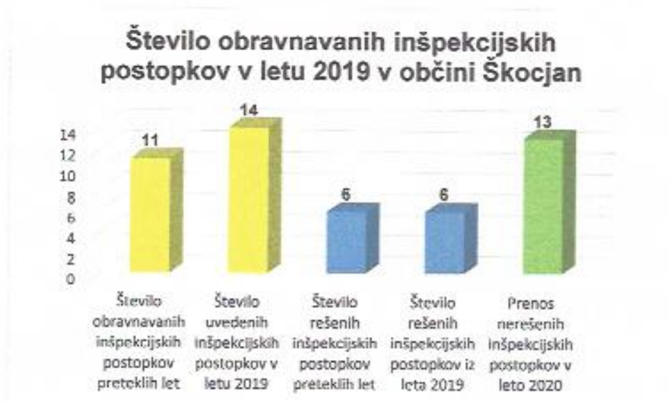
Graf 3: Število obravnavanih inšpekcijskih postopkov v letu 2019