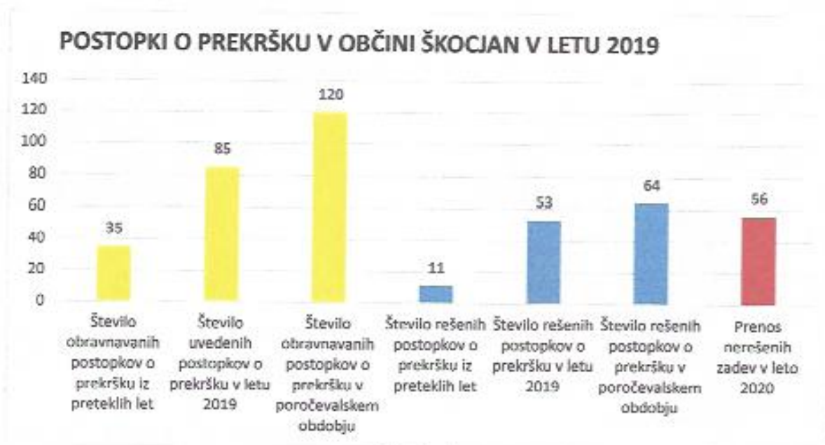
Graf 1: Prikaz podatkov iz Pn in Odl vpisnikov za leto 2019