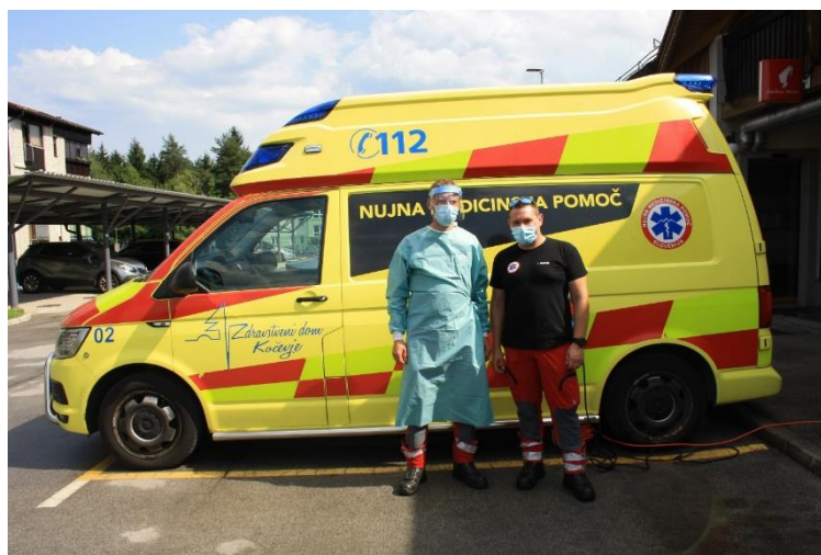
Slika 18: Mobilna enota ZD Kočevje