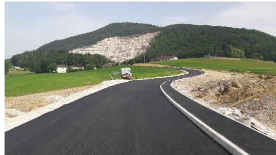
Sliki 2 in 3: Obnova JP Stranice-center

Vrednost pogodbenih del je znašala 181.600,39 € vključno z DDV-jem. Končna obračunska vrednost del pa je 179.513,64 €. Dodatno pa smo še uredili delno fekalno kanalizacijo (2.198,16 €) in vodovod (2.928,86 €) ter priključke na cesto (11.027,96 €). Končna vrednost celotne investicije (pogodbena dela, več dela, projektna dokumentacija, odmere, koordinator varnosti pri delu, nadzor ..) pa je v višini 208.384,47 €.