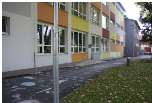
Sliki 8 in 9: Urejena okolica OŠ Zreče