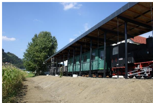
Sliki 6 in 7: Nadstrešek nad vlakom

Pripravila: Sandra Vidmar Korošec, višja svetovalka za negospodarske dejavnosti na Občini Zreče