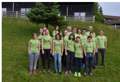
Slika 1: Raziskovalni tabor Rogla 2018

Tabor v organizaciji ZOTKS in Občine Zreče poteka ob podpori Društva ljudske tehnike Zreče, podjetja Unitur, d. o. o., Sklada za naravo Pohorje, Zavoda RS za varstvo narave, OE Celje, in Zavoda za varstvo kulturne dediščine Slovenije, OE Maribor.