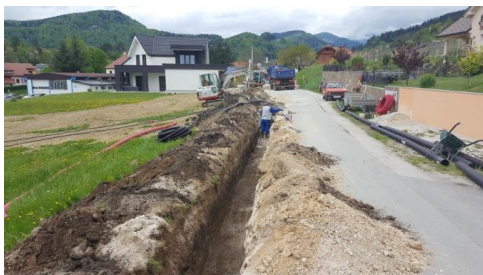
Slika 10: Med sanacijo vodovoda ob Ilirski poti

V okviru projekta je bilo potrebno zamenjati obstoječo litoželezno cev premera DN 90 mm v skupni dolžini 800 m in obnoviti sekundarne priključke. V prvi fazi smo leta 2016 zamenjali obstoječo cev v dolžini 350 m ter jo nadomestili s plastično cevjo DN90 mm (odsek Korošec - Stadion Zreče). Prav tako smo obnovili obstoječe sekundarne priključke (8 kom). Izvedba naslednje faze je bila izvedena v mesecu aprilu leta 2018. Zamenjali smo 450 m cevi in obnovili sekundarno napeljavo in obnovili 6 hišnih priključkov. S sanacijo vodovoda smo izboljšali distribucijo in kvaliteto vode. Znesek investicije za obe fazi znaša 42.000,00 EUR.