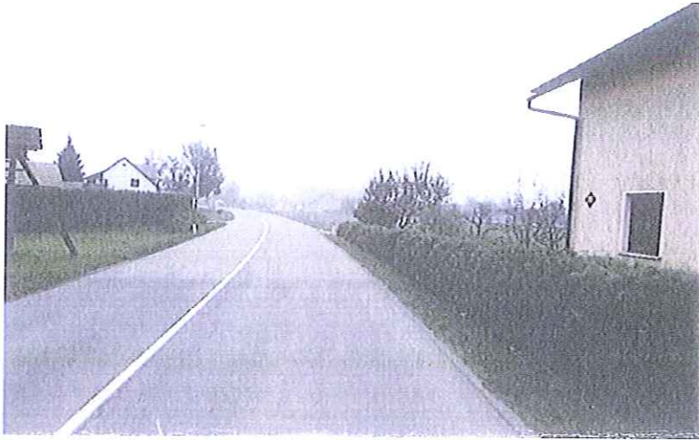
Slika 2: Obravnavano območje

Skladno z Zakonom o cestah (ZCes-1) je naselje pozidano območje ob cesti, ki ga sestavlja vsaj deset stanovanjskih stavb, ki tvorijo prostorsko celoto v kateri se pešci in vozila lahko vključujejo v promet na tej cesti preko dovoznih poti, ulic, trgov, parkov ali drugih javnih površin, meje naselja pa so označene s predpisano prometno signalizacijo; v naselje so vključeni tudi deli cest znotraj pozidanega območja, ob katerem ni stanovanjskih stavb. V obravnavanem primeru gre za šest stanovanjskih objektov, ki so locirani v bližini regionalne ceste. Med objekti in cesto se nahaja vegetacija (živa meja). Objekti se preko priključkov navezujejo na državno cesto. Glede na navedeno ugotavljamo, da pogoj za označitev naselja ni izpolnjen (pozidano območje ob cesti, ki ga sestavlja vsaj deset stanovanjskih stavb, ki tvorijo prostorsko celoto). Označitev naselja se ne bo spreminjala.