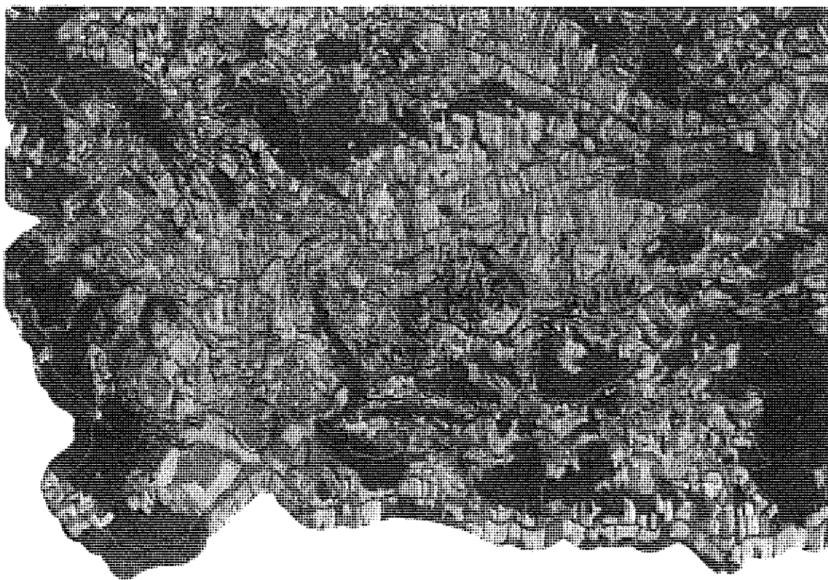
Tabela: Grafični prikaz oskrbovalnih območij s pitno vodo v Občini Rogaševci