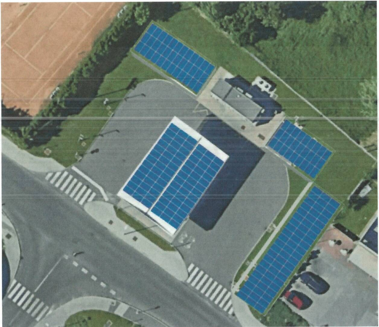
Slika 3: Prikaz umestitve nove sončne elektrarne