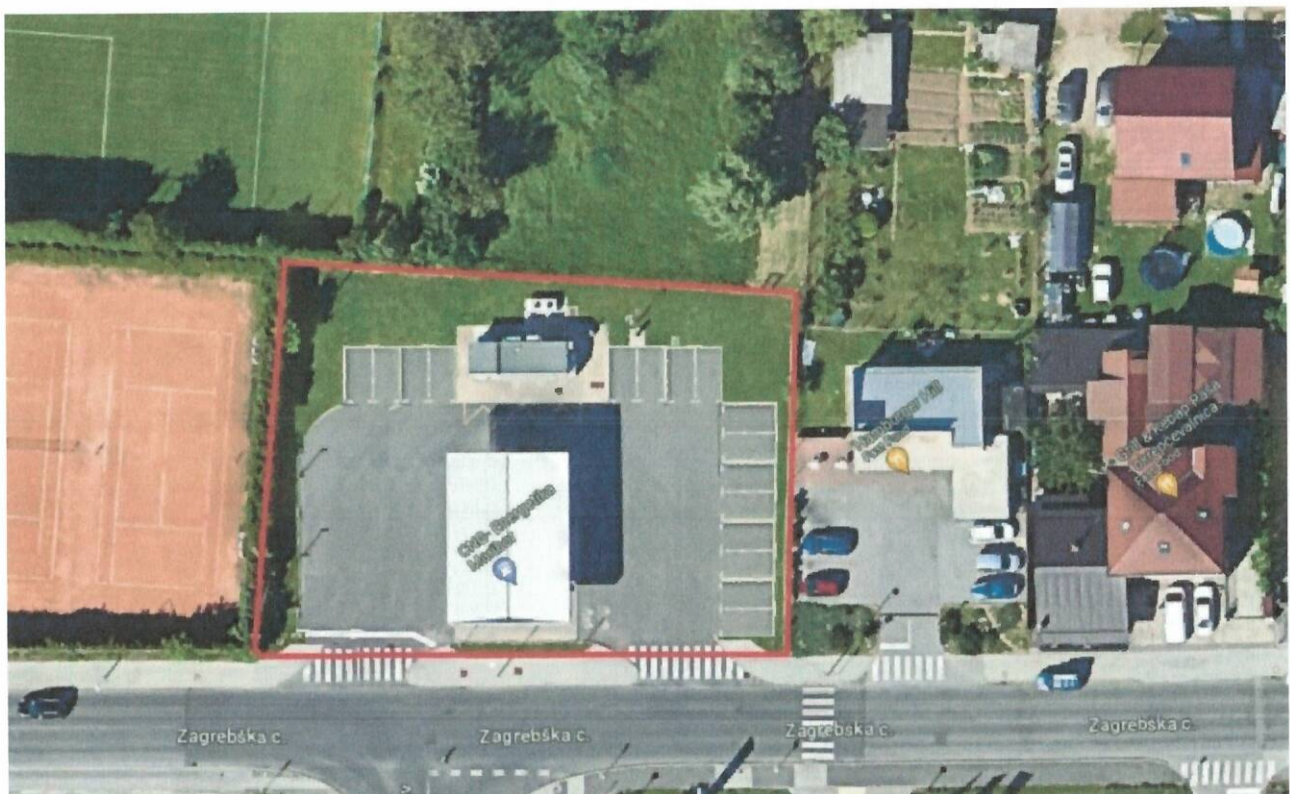
Slika 2: Umestitev novih parkirišč na lokaciju