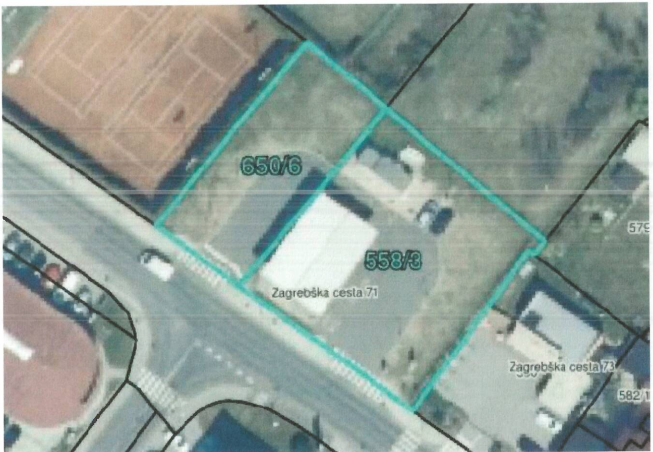
Slika 1: Lokacija polnilne postaje na CNG