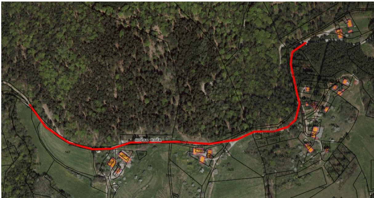
Trasa predvidene investicije lokalne ceste

Cesta je predvidena kot dvosmerna in dvopasovna, namenjena za uporabo za motorni in nemotorni promet (pešci, kolesarji) ter za dovoz stanovalcev, intervencij in dostave ter morebitnih turistov v skupni dolžini 900 m in širini 3,5 m.