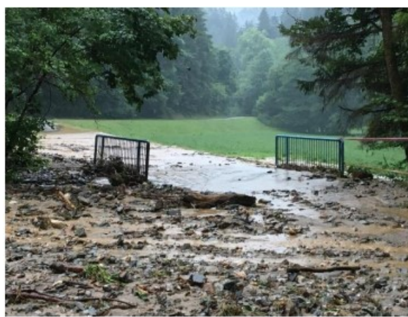
Slika 2: Preplavljanje in erodiranje LC 350361 na premostitvi potoka izpod Suhega vrha – pritok 2