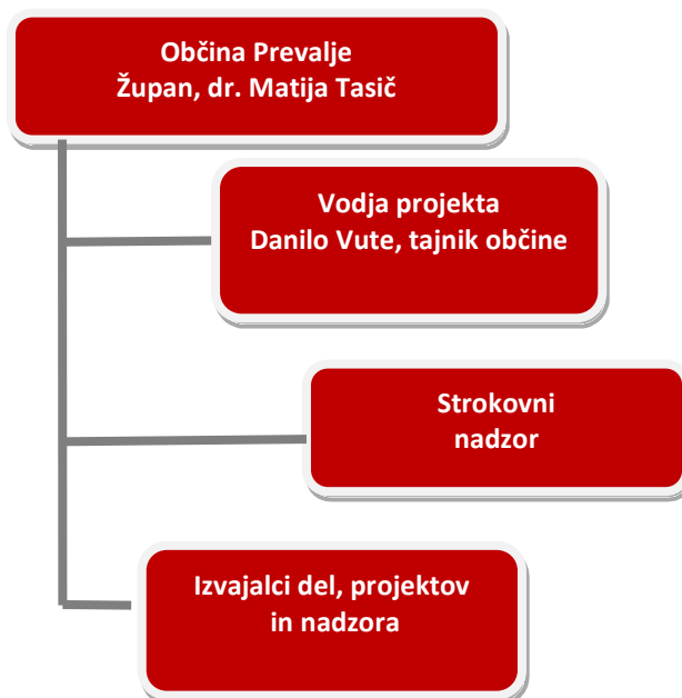
Slika 4: Organizacijska shema sodelujočih v projektni skupini

Danilo Vute, tajnik občine Njegova pristojnost je vodenje aktivnosti v zvezi z investicijo (priprava vse potrebne dokumentacije – investicijske, projektne, tehnične idr., izvajanje posameznih aktivnosti in koordinacije med posameznimi izvajalci).