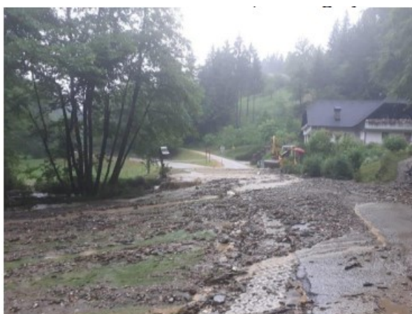
Slika 1: Preplavljanje in erodiranje LC 350361 na premostitvi potoka izpod Hudobnika v Breznici – pritok 1

V dneh 22. in 23. junija 2019 je obravnavano območje prizadelo močno neurje s poplavami in točo. Levi pritoki Šentanelске reke so preplavili in erodirali lokalno cesto LC 350361, lokalno so se ustvarili cestni podori, poškodovana se je jeklena varovalna cestna ograja. Investitor, Občina Prevalje je prijavil dogodek: Močno neurje s poplavami in točo 22. in 23. junija 2019. Škoda je prijavljena v aplikacijo AJDA pod številko vloge iz AJDE: 0043-21428043-05-0003, ID vloge je 1151710. Investitor občina Prevalje, Trg 2a, 2391 Prevalje namerava v fazi I. z vzdrževalnimi deli v javno korist sanirati plazove, urediti premostitve dveh levih pritokov Šentanelске reke in obnoviti cesto LC 350361, cesta Štopar – Šentanel, ki jo je 22. in 23. junija 2019 prizadelo močno neurje s poplavami in točo, v skupni dolžini, ki zajema fazi I, in sicer 970 m.