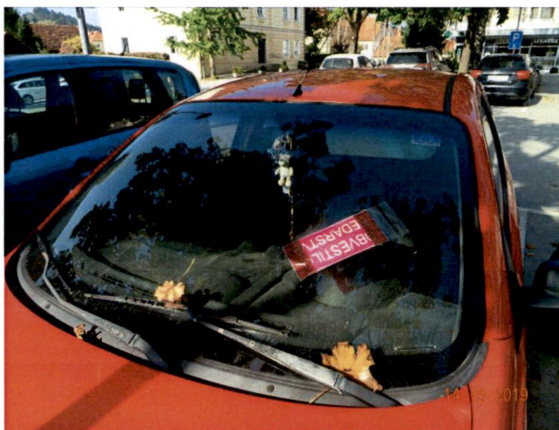
Modra cona – ni označen čas prihoda